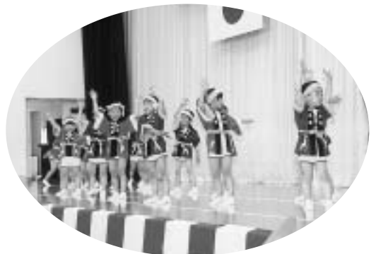
園児たちがかわいいお遊戯を披露