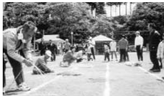
あいにくの曇り空でしたが、みんなでたのしんだ1日でした