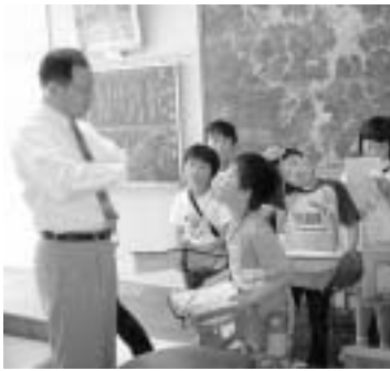
高瀬小の子どもたちと

二十日は町敬老会でした。今年の対象者は古希の方々として七十五歳以上の皆さん合わせて七百八十四人でしたがご出席は三百二十四人でした。最高齢は