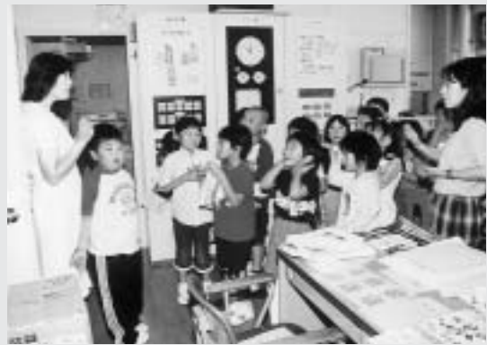
職員室に避難する子どもたち

訓練では、刃物を持った不審者が教室に入り、児童に危害を加えようとしているとの想定で行われ、教師は非常用アラームを鳴らすと同時に子どもたちを職員室に誘導。子どもたちは素早く安全な場所へ逃げ込み、周りの職員に状況を報告するなど本番さながらの訓練を展開しました。