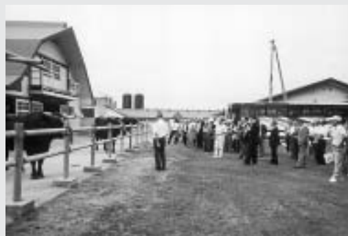
県畜産試験場を訪れる自治会長の皆さん

本年度の研修地は、県農業科学館、県畜産試験場、かみおか嶽雄館など。参加した自治会長の皆さんは熱心に研修地を見学し、本町の主要産業である農業や畜産について研修し合いました。