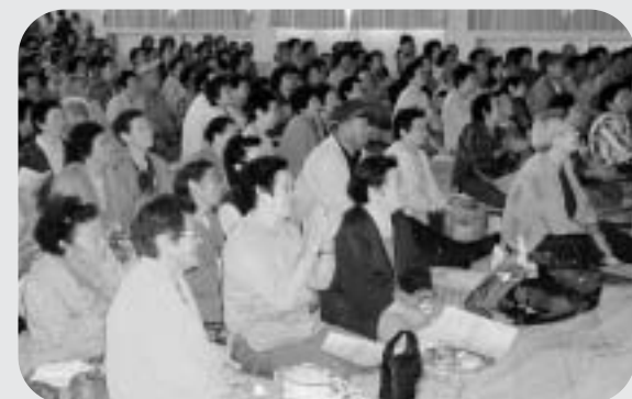
歌や踊りを楽しむ観客