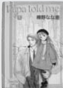
コミック 「papa told me 1-26 / 榎野なな恵」

「知世のパパは小説を書いています。ママは夜空の星になりました。知世とパパは二人暮りですが、いつも明るく生きています。自由で創造的な父子家庭をめざして、ドジったりするけれど、小学生の知世ちゃんが大人を相手に奮闘する大好評シリーズ」