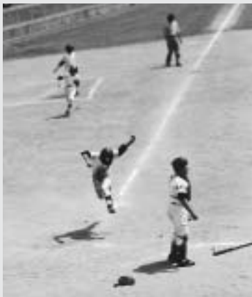
各チームが熱戦を繰り広げた学童野球大会

両チームとも、惜しくも初戦で破れましたが、カいっばいのプレーに応援席からはたくさん声援と拍手が送られていました。