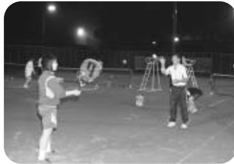
6月20日のテニス教室から

六月二十日から七月十八日までの毎週木曜日、公民館と東由利テニスクラブ主催のナイターテニス教室（全五回）が町民テニスコートで行われており、毎回テニス愛好者が参加し、心地よい汗を流しています。