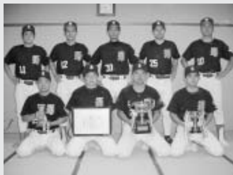
優勝を喜ぶ商工会青年部のナイン