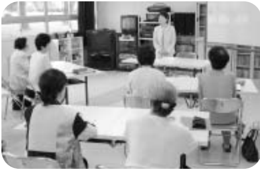
講座を受けるサポーター予定者

六月十九日、公民館学習室で子育てサポーター養成講座が行われ、サポーター予定者六名が参加しました。