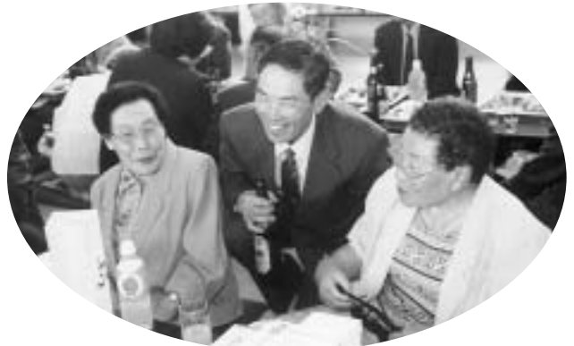
互いに長寿を喜び合う