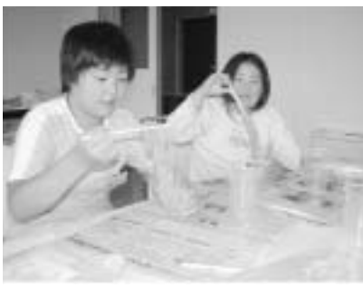
6月22日の理科教室ではスライム作りに挑戦した