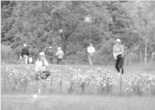
ゲームを楽しむ参加者