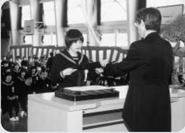
卒業証書を受け取る生徒（東由利中学校）

式では、在校生や保護者が見守る中、校長が卒業証書を手渡し、巣立っていく卒業生を激励。式を終えた卒業生らは、玄関先で見送る恩師や後輩との別れを惜しみながら、思い出いっぱいのお学舎を後にしました。