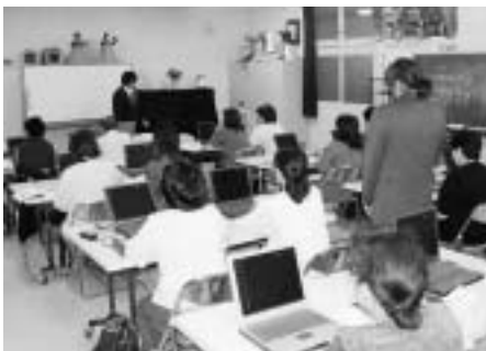
去年度の「Excel」講習会(初級)から