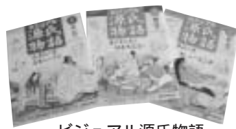
ビジュアル源氏物語