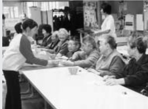
お点前を披露する児童