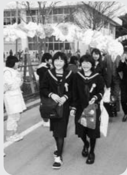
学舎を後にする卒業生（高瀬小学校）