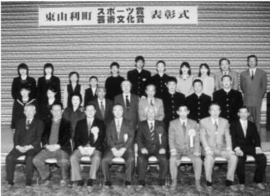
両賞を受賞された皆さん

今年度はスポーツ賞で十六個人と一団体、芸術文化賞で九個人がそれぞれの団体会長から表彰されました。(受賞者別記・敬称略)