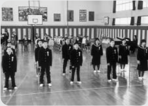
力強く校歌を歌う卒業生（大琴小学校）