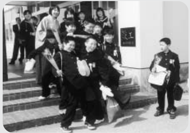
卒業生がみんなと一緒に記念写真（八塩小学校）