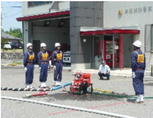
小型ポンプ操法競技 第1位 第3部1班