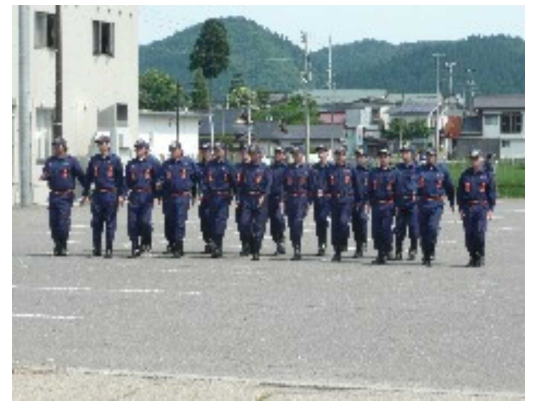
訓練礼式の部 第1位 第4部

で第3部第1班、訓練礼式で第4部がそれぞれ第一位となり、総合では第3部が優勝しました。