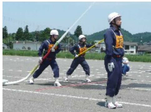
白熱した小型ポンプ操法競技