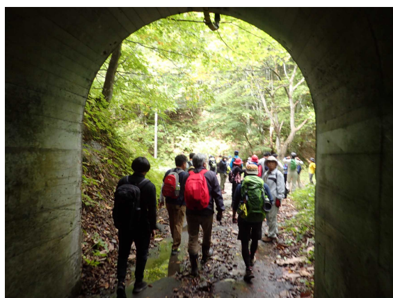
ウォーキングの様子

10月10日に由利・矢島・鳥海・東由利の4地区合同ウォーキング交流会が開催され、小学生から87歳まで幅広い年代から総勢38人が参加しました。