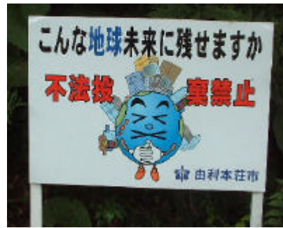
管内に設置されている注意看板

町内の広範囲にわたっており、また、投棄されるごみも家電や廃タイヤ、産業廃棄物など多様化、悪質化してきています。 お互いに注意し合い、環境破壊をしないようにしましょう。