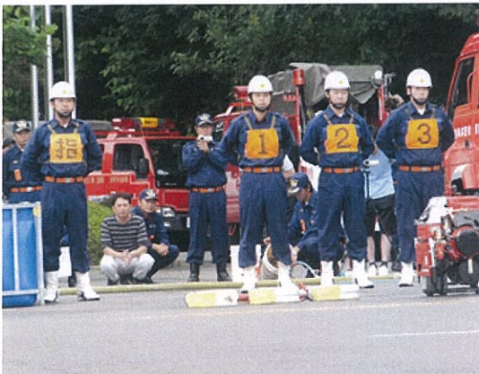
△第4分団操法員による 小型ポンプ操法の様子