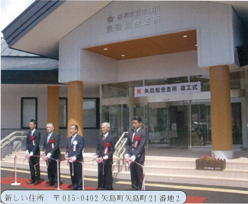
新しい住所 〒015-0402 矢島町矢島町 21 番地 2

矢島総合支所新庁舎が完成し、8月18日（火）に竣工式が開催されました。長谷部市長をはじめ工事関係者らが出席して新庁舎の完成を祝いました。