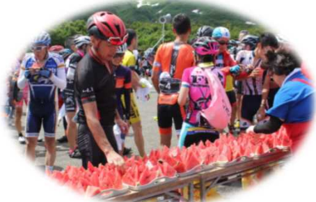
ゴール祓川での「スイカ」のサービス

両日とも、強風の中での厳しいレースとなりましたが、ゴールの祓川を目指し、ひたすらにペダルをこぐ選手に、沿道から大きな声援が送られておりました。