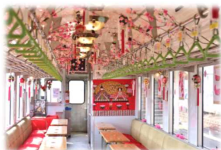
【由利高原鉄道HPより おひなっこ列車】