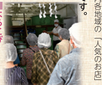
酒蔵見学は1週間前までの予約があれば随時行っている。従業員が多いので案内説明ができる

30年ほど前から力を入れている海外輸出は、ここ10年の和食ブームに伴い増え続け、今では全体出荷量の1割ほどがアメリカや近隣のアジア諸国へ。商品をきっかけに地域に興味をもってくれたらうれしいし、こつこつと変わらぬおいしい酒造りを続けていきたい。