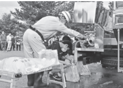
給水訓練を行う大内中の生徒ら（大内中）

が地域一斉に実施されたほか、建物火災を想定した消防署と消防団による駆け付け訓練、逃げ遅れを想定した消防防災ヘリ「なまはげ」やはしご車による救出訓練などが行われました。小中学校では避難訓練のほか、避難所運営訓練や煙体験、地震体験が実施され、児童や生徒らは緊張感を持ちながら、真剣に訓練に取り組んでいました。湊市長は「災害に負けな