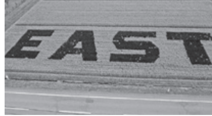
田んぼに古代米で描かれた「EAST」

8月26日、古代米で描かれた田んぼアートの稲刈り体験が本荘東中学校で行われました。