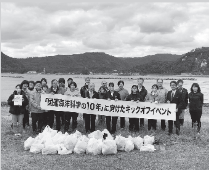
隠岐で開催されたクリーンアップ活動（2021年11月）

ジオパークは地域資源だけではなく、地球資源の保全保護を行いながら地域活性化を行う活動で、まさに地球に寄り添う活動です。近年よく耳にするSDGsを達成するためには、その地域のことだけに取り組むのではなく、日本や地球全体の問題に取り組まなければなりません。そういった面では、ジオパーク活動はSDGs実現のための主体と成り得る活動だと考えています。2021年は国連海洋科学の10年のスタート年であり、日本ジオパークネットワークとしても、海洋環境問題に取り組むこととしました。これまで海岸漂着物については、離島地域や海岸地域だけの問題として捉えられてきましたが、海岸漂着物の7割以上は河川からのごみであり、内陸部の地域にも関係することから、日本ジオパークネットワークのキックオフイベントを昨年11月に隠岐で開催しました。