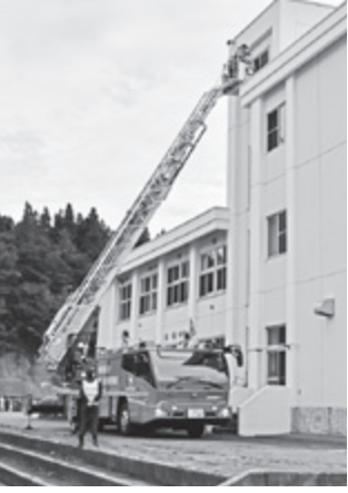
はしご車による救助訓練（大内小）

が地域一斉に実施されたほか、建物火災を想定した消防署と消防団による駆け付け訓練、逃げ遅れを想定した消防防災ヘリ「なまはげ」やはしご車による救出訓練などが行われました。小中学校では避難訓練のほか、避難所運営訓練や煙体験、地震体験が実施され、児童や生徒らは緊張感を持ちながら、真剣に訓練に取り組んでいました。湊市長は「災害に負けな