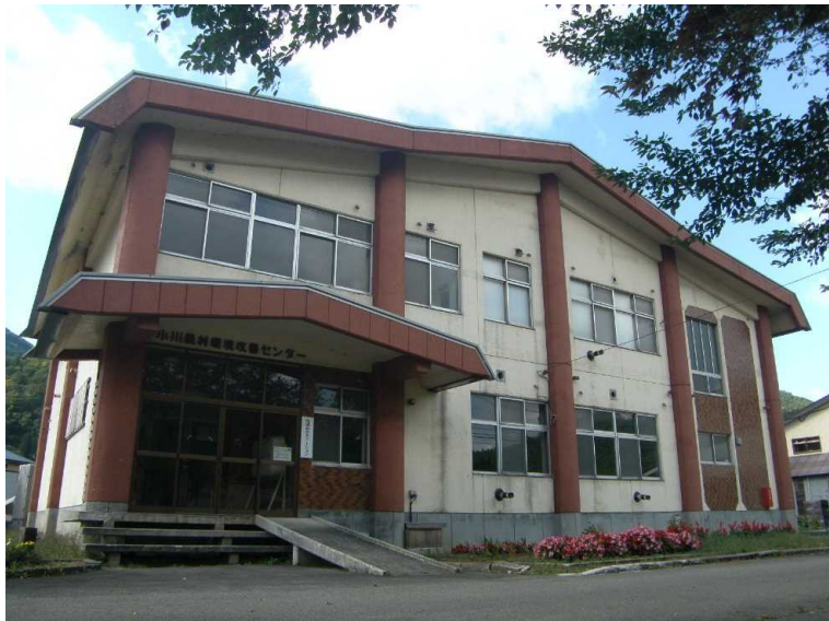
小川農村環境改善センター