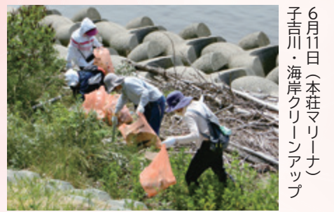
6月11日(本荘マリーナ) 子吉川・海岸クリーンアップ

主に各所でのクリーンアップ活動に取り組んでいます。6月に行われた子吉川での活動では、6450kg分のゴミを回収。また環境問題に関わる勉強会を定期的に開催し、会員同士で意見交換をしています。今後は保育園・幼稚園児を対象に紙芝居を通じた環境啓発活動も予定