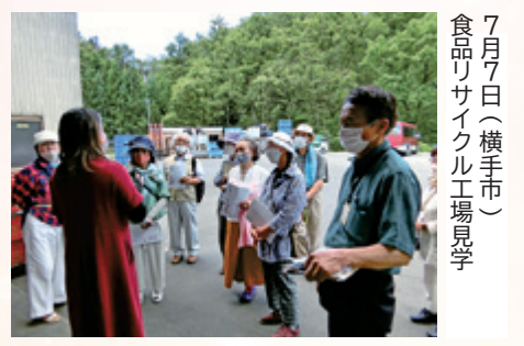
7月7日(横手市) 食品リサイクル工場見学