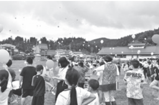
メッセージを付けた風船を空に飛ばす児童ら

フェスタでは、児童がプロジェクトに協力した企業や有志の方々へ感謝のメッセージを伝え、参加者らとクイズやゲームなどで交流を深めました。そして最後に、たくさんの人へ笑顔の種が届くようにと、ヒマワリの種と手書きのメッセージを付けた色とりどりの風船を一齐に空へ飛ばしました。参加者らは自分の手を離れて、空高く上っていく