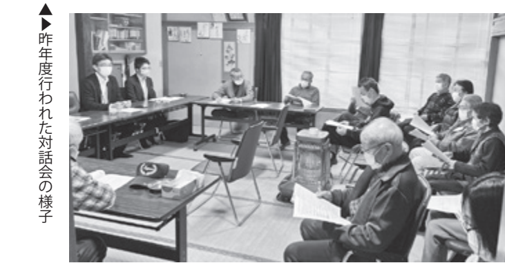
▲▶▶昨年度行われた対話会の様子

近年、高齢化の進展や免許返納の浸透によって「生活の足」に関して不安に思う方が多くなっています。しかし、公共交通機関の利用者は減少の一途をたどり、非常に難しい状況になっています。 市では、こうした公共交通機関の現状やその必要性をお伝えしながら、市民の皆さまのご意見をお伺いするため、対話会を開催したいと考えています。 町内会や老人クラブ、各種団体、個人的な集まりなど対象は限定しません。対話会を開催する時間帯や曜日についても、ご要望に応じて対応し