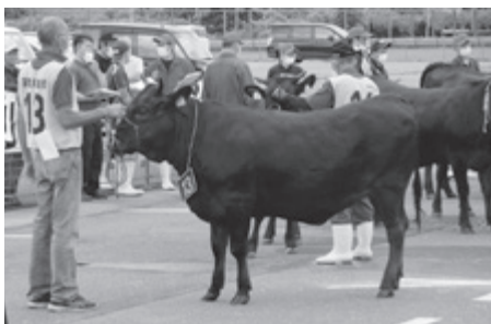
審査のため並ぶ牛