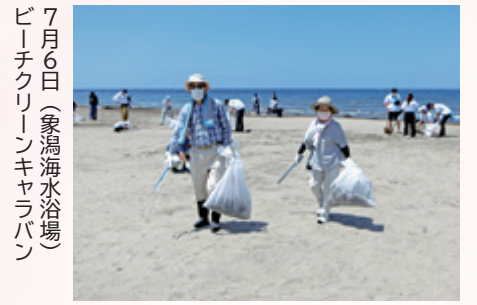
7月6日(象潟海水浴場) ビーチクリーンキャラバン