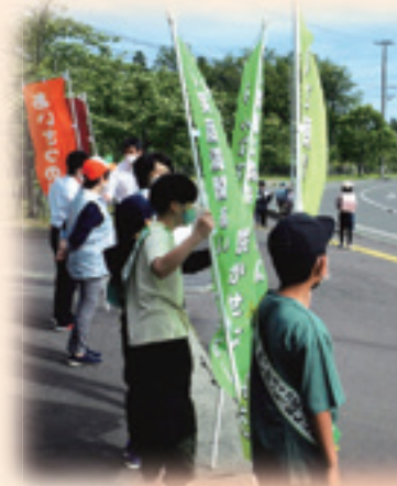
通学路の見守り 登下校時の見守り やあいさつ運動

「地域の方々の力になれたらいいな」という思いで活動しています。訪問を受けた方が「民生委員に相談してよかった、来てくれて助かった」と思ってもらえればうれしいです。秘密を守ること、人権を尊重すること、緊急のことは優先的に対応することなども心掛けています。