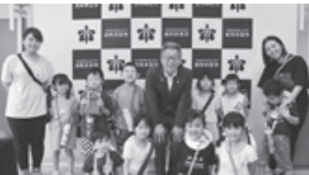
訪れた本荘幼稚園の園児たち

いるんですか」「好きな食べ物は何ですか」と尋ねるなど、市長との会話を楽しんでいました。園児からは、「市長と会って」たのしかった」「きんちようした」など訪問した感想が聞かれました。