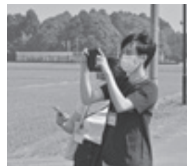
映える風景を撮影する参加者

参加者らは本荘駅から矢島駅までおばこ号に乗って移動。その車内では自己紹介や会話を楽しみながら、車窓から撮ることが出来る映えスポットを探し、鳥海山などを撮影しました。矢島駅からは貸し切りバスで曲沢駅と鮎川駅に移動し、映える風景やものを撮影。三脚を使い自撮りする姿もありました。終わりに互いの写真を見せ合い、良いところを褒め合いました。