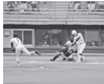
相手の投球を打ち返す本荘高校の打者

スタンドの一塁側と三塁側に本荘高の全校生徒が半々に分かれ、それぞれ本荘高と作新学院高をプラスバ