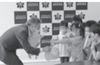
花束などを贈る園児