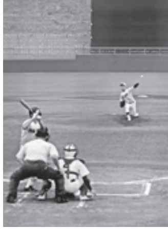
投球する本荘高校の投手

本荘高校の創立120周年を記念した硬式野球とサッカーの招待試合が6月17日、水林グリーンスタジアムおよび同陸上競技場で行われました。