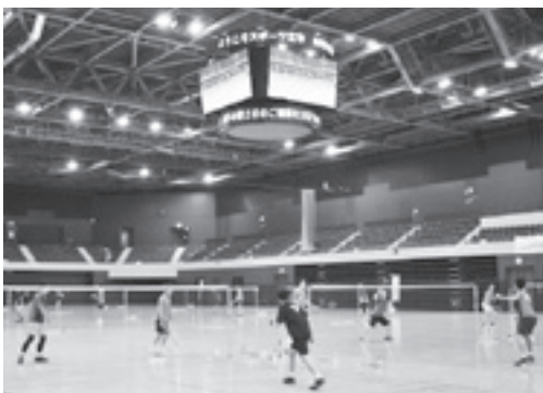
昨年5月にナイスアリーナで行われた同代表による強化合宿の様子

バドミントンの日本代表（B代表）が、ナイスアリーナで合宿を行います。また、下記の日程で練習の様子を一般公開します。トップアスリートの練習を見学できる貴重な機会ですので、ぜひご来場ください。