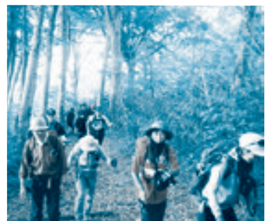
山頂を目指し登り始める参加者

その後の記念登山では、参加者らは一部にまだ雪が残る登山道を、ストックを使いながら山頂を目指して