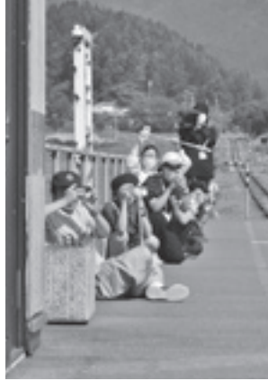
曲沢駅に来るおばこ号を撮影する参加者

6月18日に若者の交流の場をつくるアベイバプロジェクトの1回目となるイベント「いつもの街で見つける映えスポット探し」が開催されました。