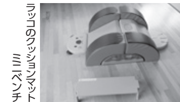
ラッコのクッションマット ミニシンチ