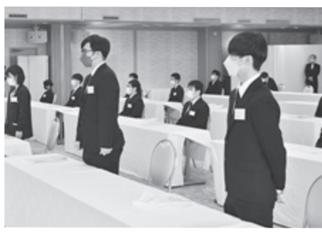
1人ずつ紹介される新入社員