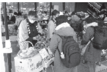
こととやビナフロント海老名店でのPR販売会▼