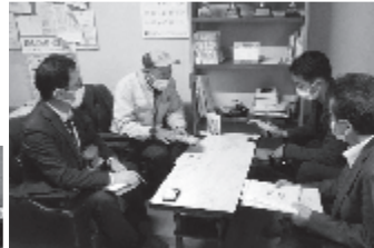
▲市のバイヤー招聘（しょうへい）事業に参画して自社商品を提案