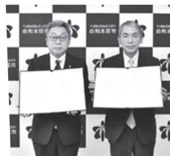
協定書を手にする湊市長(左)と川口局長(右)