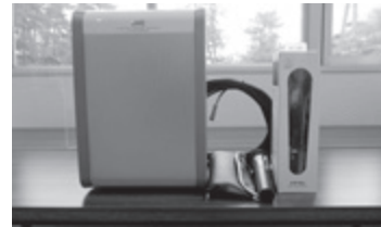
ワイヤレススピーカー