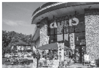
▲京北スーパーアプリス店でのPR販売会