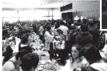
ナイスアリーナで特産品を販売▼