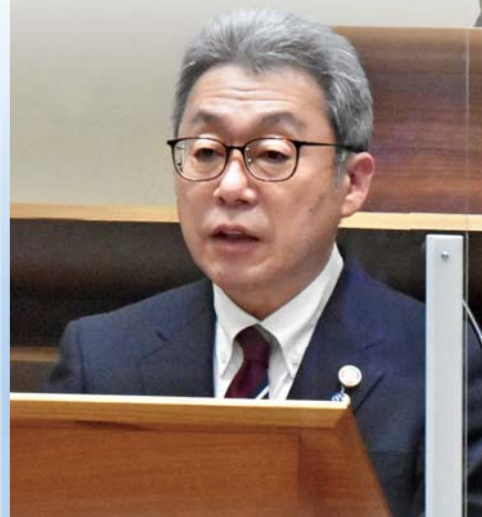
施政方針を述べる湊市長 (2月16日、令和4年第1回 市議会定例会)