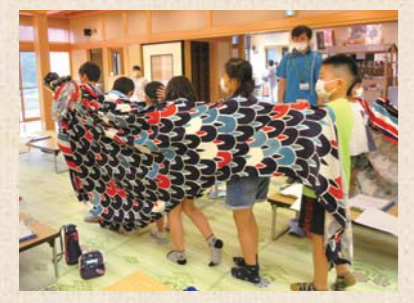
まいーれでの民俗芸能体験