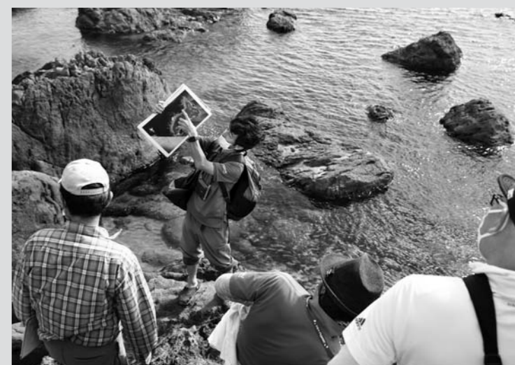
当ジオパークガイドが案内する様子

当ジオパークには、61人の認定ジオガイドが活躍しています。私は2015年に開始されたジオガイド養成講座で「伝え方」と「安全管理」の講義を担当させていただきました。