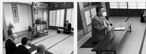
大内深沢地区（2月27日）