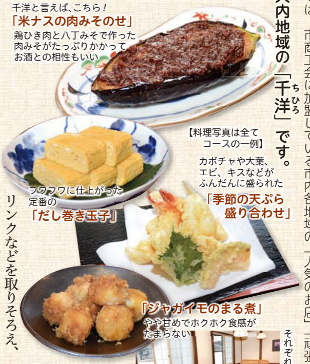
千洋と言えば、こちら！ 「米ナスの肉みそせ」 鶏ひき肉と八丁みそで作った肉みそがたっぷりかかってお酒との相性もいい

大内で生まれ育ち、高校からは親の出稼ぎ先の長野県へ。子どもの頃から料理好きだったこともあり、親の猛反対を押し切り料理人を志す。高校卒業後は日中に給食センターで働き、夜は料理店で手伝いをしながら料理の勉強に励んだ。その後はホテルの調理場や菓子店などに勤め、幅広い分野にわたって料理のスキルを磨くと、平成3年に地元