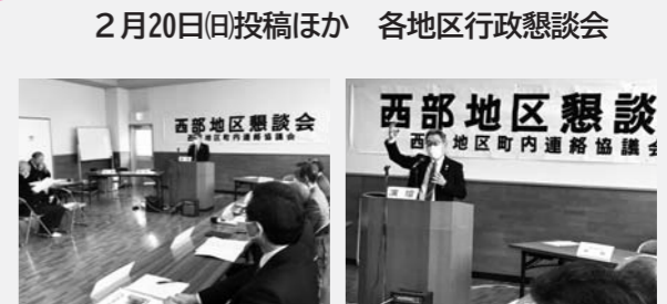
本荘西部地区（2月20日）

各地区で開催されている行政懇談会に出席し、市政について講話をさせていただきました。 講話後には要望の回答も行いました。前向きだったり、厳しかったり、さまざまな反応がありました。 有意義な意見をいただいたので、今後の市政に生かしていきたいと思っております。