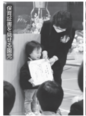
保育証書を見せる園児