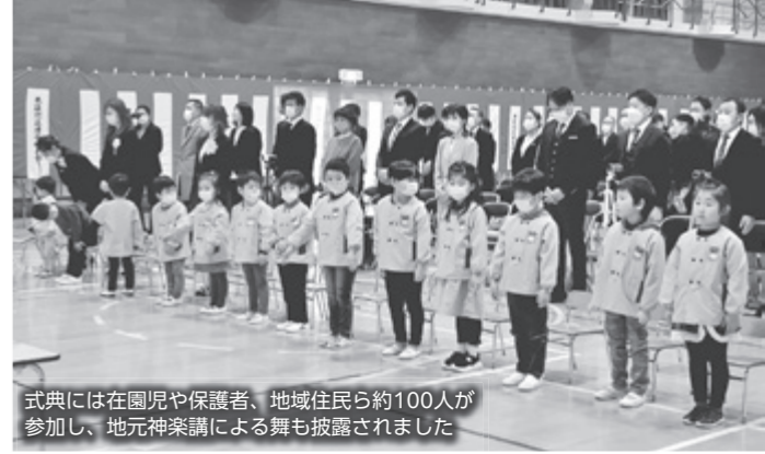
式典には在園児や保護者、地域住民ら約100人が参加し、地元音楽隊による舞も披露されました