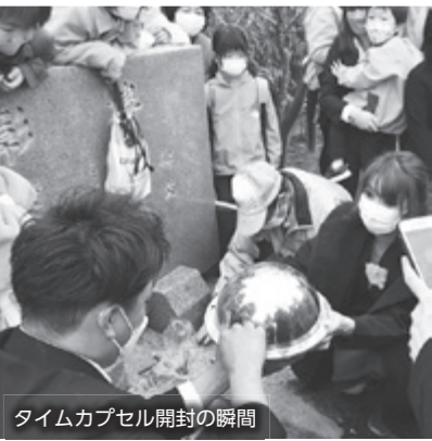
タイムカプセル開封の瞬間