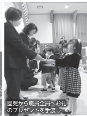
園児から職員全員へお礼のプレゼントを手渡し