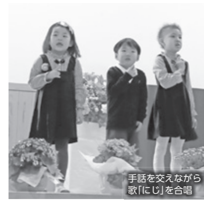
手話を交えながら歌「にじ」を合唱