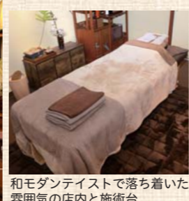
和モダンテイストで落ち着いた雰囲気の内と施術台

■施術コース 頭から足先までタオルの上から全身をほぐしていく「ボディケア」、膝周辺から「フットケア」、首から胸上にかけての疲れだまりをほぐしていく「リンパドレナーージュ」の全3コースがあり、それぞれのコースを組み合わせても可能。中でも1番人気はボディケアで、要望に応じてコースにはな