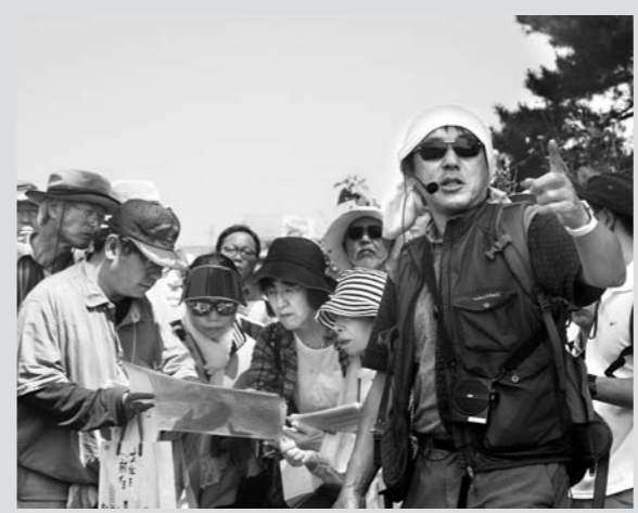
ガイド養成講座で指導する様子

ジオパークは「大地の公園」です。そこは「地球の秘密」について学べる場所です。「地球の秘密」は、実は子どもたちにとって、とても知ってほしいことの一つです。 ふるさと教育はとても大切です（私も大学院で「ふるさと教育」の講義を行っています）。ふるさとに誇りを持ってこそ、立派な一人の大人として自立していけますし、将来ふるさとを発展させることができます。 ふるさとは人々の暮らしがあります。そして、それを成り立たせているのは、その土地の風土です。たとえば、鳥海山・飛島ジオパークのある由利本荘市から酒田市にかけての地域はものすごく雪が降ります。東北地方の日本海側は世界でも有数の豪雪地帯です。特に鳥海山の上の雪には、ものすごいものがあります。 雪が多いということはたいへんなことなのですが、同時に豊かな水資源を私たちに与えてくれます。それがこの土地の産業や暮らしを形作っています。このような風土をつくったのは、実は大地の力です。雪がこの地域に多いのは1500万年前に日本海が出来たためですし、これほど雪が降るのはマグマが噴き出して出来た鳥海山や地震のたびに隆起してきた羽根山地があるためです。 鳥海山・飛島ジオパークの子どもたちには、ぜひふるさとを作った「地球の秘密」について学んでほしいと思います。