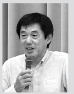
秋田大学 林 信太郎 教授