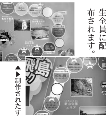
制作されたすごろく