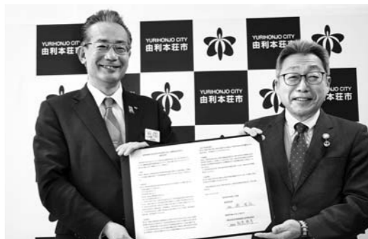
協定書を手にする知見秋田支社長（左）と湊市長（右）