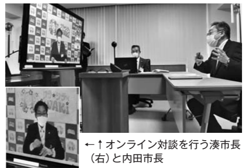
←オンライン対談を行う湊市長（右）と内田市長

岩城町と福島県いわき市は昭和61年に親子都市の盟約を締結し、本年度で35周年を迎えました。合併後も「旧藩祭」といわき市の「いわきおどり」の相互訪問や、両市の中学生交流を行っています。当初は記念式典の開催を予定していましたが、新型コロナウイルス感染症の影響により中止し、代替として2月7日にいわき市・内田広之市長と湊市長がオンライン対談を行いました。対談では、新たな事業の実施検討も含め、今後もさらに交流を深めていくことを約束しました。