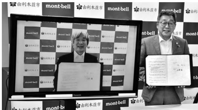
協定書を手にする辰野会長(左)と湊市長(右)

本市とアウトドア用品を製造販売する(株)モンベル(大阪市)が「連携と協力に関する包括協定」を締結しました。