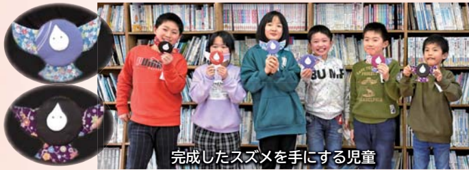
完成したスズメを手にする児童

本年度の「矢島町中ひなめぐり」は中止になってしまいました。制作の柳かざりは、4月3日まで矢島郷土資料館に展示されています。