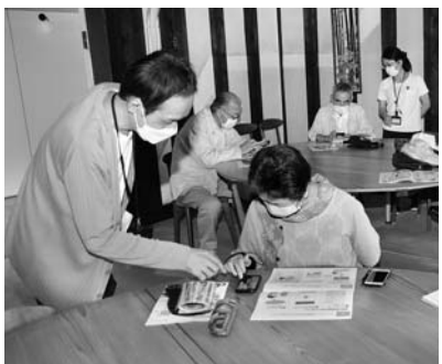
スマホの操作方法を学ぶ参加者