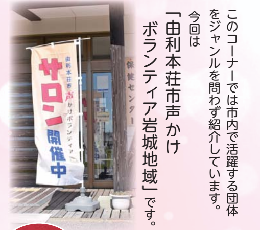
貝がらを使ったおひなさまづくり(高城センター)

つサロンを開催。毎回保健師による血圧測定と健康相談を行いながら、さまざまなテーマを企画しています。講師を招いての講話では、由利本荘警察署員からシミュレーション機械を使った横断歩道の渡り方や、市の担当職員から防災について、北部包括支援センター職員からは認知症について学ぶなどしています。