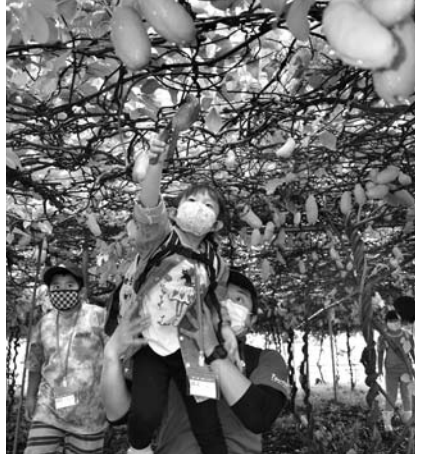
アケビ狩りを体験する参加者