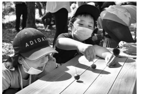
クヌギのドングリこまで遊ぶ参加者

鳥海山木のおもちゃ美術館では、小学1年生～4年生の親子を対象に、森や川で遊びながら自然に親しむことを目的とした「もくいく体験塾」を6月、8月、10月の日程で全3回開催しています。最終日となった10月3日は、市内外から11組28人の親子が参加し、秋めく森や山の恵みに触れながら学びました。