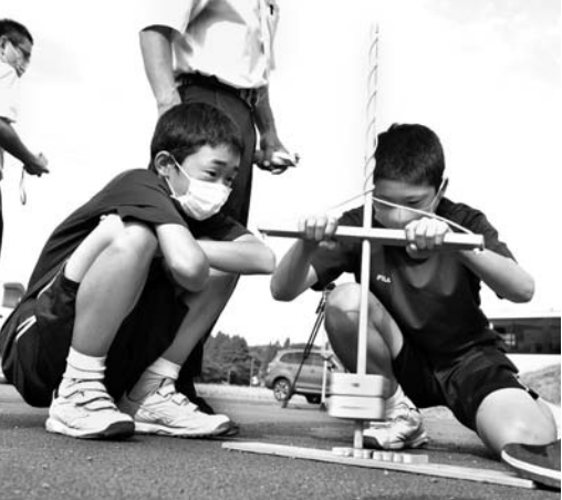
火起こし体験をする生徒たち