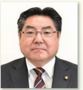
岡見 善人氏 立憲民主党・現② (57歳・岩谷麓)