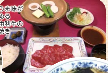
肉のうま味が楽しめる秋田由利牛の陶板焼き