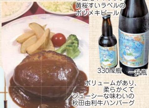
ご当地キャラクター黄桜すいらベルの赤ツメキビール

■おすすめ 地場産の食材を使ったメニューが豊富なレストランのお食事処「やしお」で、1番人気は秋田由利牛ハンバーグ定食。自然豊かな鳥海山麓で育まれた秋田由利牛の味は絶品で、陶板焼き定食は1日10食限定のぜいたくな一品に。地元特産のフランス鴨メニューは、コクのあるうま味とまろやかな味わいが評判で、鴨ラーメンと鴨そばが特に人気。11月12日まで開催中の「秋の食味会」は1日3組、20人限定の予約制会食イベント。レストランメニューとは別で旬の食材をふんだんに使った秋の味覚を楽しめる。