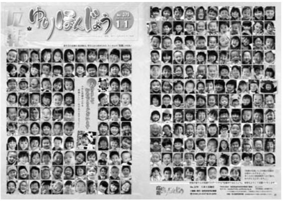
本年1月1日号の表紙・裏表紙

新年を祝い、『広報ゆりほんじょう』1月1日号の表紙を皆さんの笑顔で飾ってください。ご応募をお待ちしています。