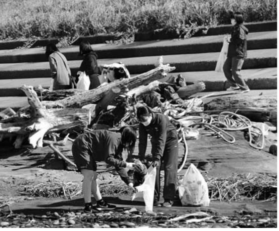
海岸のごみを拾う西目高校の生徒たち

西目高校の生徒が10月9日、西目海水浴場でごみ拾いボランティア活動を行いました。この活動は、海と日本プロジェクトによる海辺の清掃活動「CHANG E FOR THE BLUE」秋の海ごみゼロウイークと連携して行ったもので、同校ボランティア委員会が中心となって校内で呼びかけし、1年生から3年生までの約60人の生徒が参加。生徒たちは白色半透明の袋に青文字の赤文字の袋の2種類を手に持ち、青色には可燃ごみを、赤色には不燃ごみを入れながら