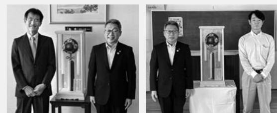
(株)秋田新電元さま 矢島通商(株)さま

秋田県企業誘致推進協議会による永年立地企業感謝状贈呈式が行われ、本市から半導体製造の「(株)秋田新電元」さまと、繊維製造メーカーの「(株)直営工場の「矢島通商(株)」さまの2社が表彰されました。昭和45年誘致認定から50年、長きにわたり当地にて貢献されています。市からは記念品として、本荘「てんまり」を贈呈しました。