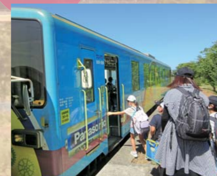
まなぶんチャレンジツアー (由利鉄車両基地/まいーれ)

いただいた寄附金は「ふるさとさくら基金」として、まちづくりや子どもたちへの 支援・育成事業などに活用させていただきます。