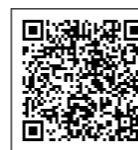
ふるさとチョイス

本市では下記3サイトから申し込みができます。 〈クレジットや電子マネーでの決済ができます〉