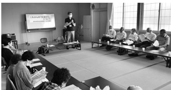
▲昨年度は町内会と老人クラブに呼びかけて30回ほど開催