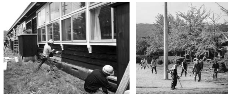
ボランティア活動の様子（左：6月24日・外壁塗装、右：同26日・草刈り）

また、このたびの開館3周年イベントを迎えるにあたり、同館では地域ボランティアによるさまざまな施