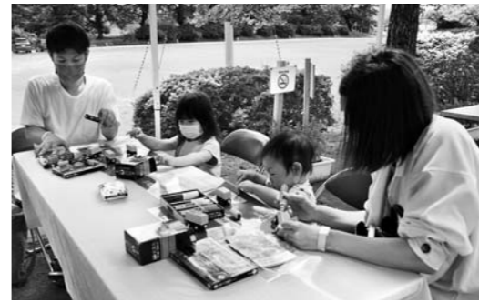
木育おもちゃまつり・てづくりワークショップ

ラ5本を同館の裏山に植樹しました。木育おもちゃまつりでは、出店やワークショップの各ブースがずらりと並びました。7つの出店が集まった「あゆかわマルシェ」では地元野菜やお菓子、手づくり小物などを販売。木を使った工作などの体験ができる「てづくりワークショップ」では、親子で仲良く作業をする姿が見られるなど、多くの来場者でにぎわいました。