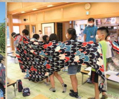
地域資源を再認識するとともに、ふるさと愛を育み 地域に根付く人材を育成する取り組み。