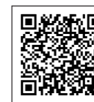
楽天ふるさと納税

ふるさと納税サイトを装った偽サイトにはご注意ください！ ※ふるさと納税の性質上、割り引きなどは実施できません。