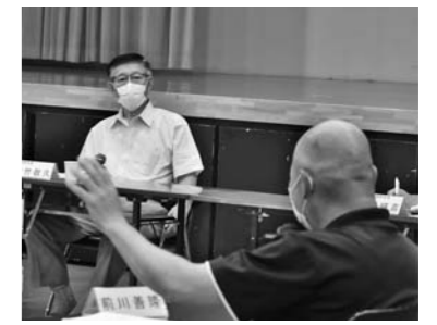
佐竹知事（左）と意見を交わす参加者（右）

県民の声を県政運営に反映させることを目的とした「知事と県民の意見交換会」が7月9日に本市で開催されました。