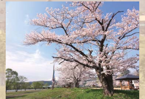
市の花「さくら」を活用したまちづくり さくらの植樹や保護など、観光と一体となった 活力とにぎわいのあるまちづくりの実施。