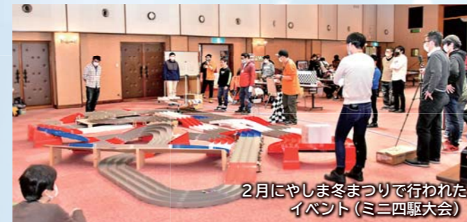
2月にやしま冬まつりで行われた イベント(ミニ四駆大会)