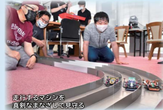
走行するマシンを 真剣なまなざしで見守る

4年前にミニ四駆の情報共有や全国大会などに出場するために結成。東北大会での優勝者を出すなど積極的に活動しています。現在の会員は小学生から40代までの20人ほど。普段は石脇の「ミニ四駆くらぶHonjo」のコース