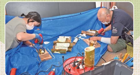
竹筒に貼られた下絵(利用者がデザインしたもの)に沿ってドリルで穴開けし、模様を描いていく