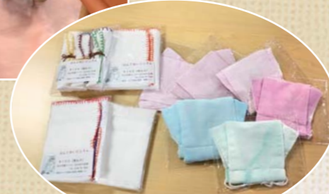
手作りのマスクや布巾