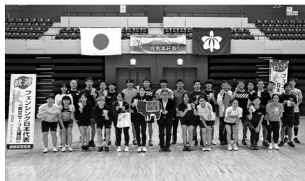
激励に訪れた湊市長と記念撮影