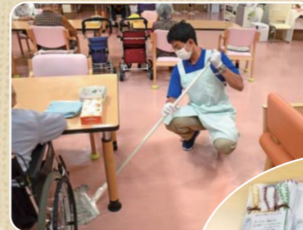
隣接する介護福祉施設での清掃作業(施設外就労)

平成29年10月に開所。施設を利用する障がい者は知的が6人、精神が16人、身体が3人の計25人。平均年齢は30代前半と若く比較的作業能力が高い人が多いため、受注したものを作って納品する施設内作業や、一般企業などでの施設外就労も行う。開所3年で1人当たりの平均工賃が月2万円に達し、次の目標は月2万5千円。利用者にとって生活の質の向上を目指すとともに、社会自立へ貢献していきます。