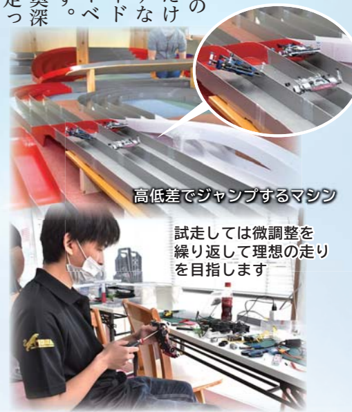
高低差でジャンプするマシン