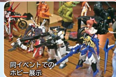
同イベントでの ホビー展示