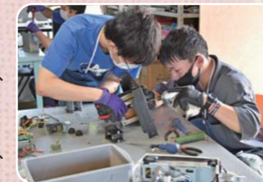
電気製品などを細かく分解・分別していく

市内には、障がいを持つ方々による創作活動への取り組みや、就労の訓練を行うための事業所があります。活動の内容はさまざまですが、そのうち13の事業所(3ヶ所参照)では、製品や農産物を販売したり、草刈りなどの軽作業を外部から受注したりしています。皆さんの職場や町内会などでも、このような事業所に仕事の依頼や製品購入の相談をしてみませんか。そのご相談が、障がいを持つ方々の応援や取り組みの理解につながります。障がいを持つ方々が、それぞれの個性や能力を生かし、意欲を持って活動を継続できるように、障がい者就労施設への作業委託や製品などの購入をぜひご検討ください。