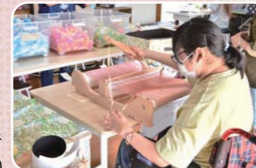
丁寧に手織りで作られるランチョンマット

令和2年9月に開所。施設を利用する障がい者は知的が8人、精神が10人、身体が2人の計20人。現在はミシンで衣服やアクセサリーなどを作る縫製等作業や、電気製品やパソコンを分解するリサイクル作業などが主体だが、今後はさらに活動を増やしていきたい。利用者に対しては希望があれば送迎や昼食の提供なども行い、仕事に来るのを楽しんでくれるような事業所を目指しています。