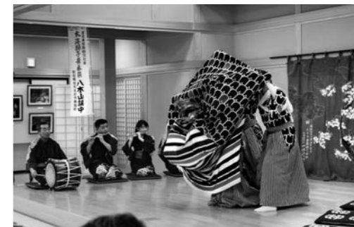
本海獅子舞番楽正月公演事業