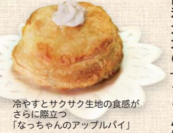
冷やすとサクサク生地食感がさらに際立つ「なっちゃんのアップルパイ」

このコーナーでは、市商工会に加盟している市内各地域の「人気のお店」、「頑張る会社」を紹介しています。今回は、由利地域の「ぐらんぱぐらんま」です。