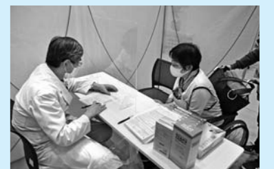
② 医師による予診で接種が適当か不適当かを判断