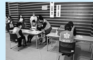
① 予診票を確認し、電子体温計を回収（会場入り口での検温のほか体温測定も実施）