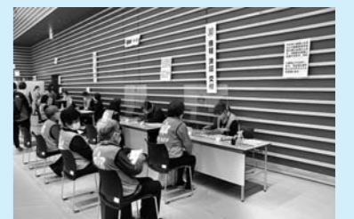
④ 接種済証を発行し、2回目接種の予約相談を受け付け

問い合わせ先 健康管理課 新型コロナウイルス ワクチン接種推進室 ☎74-7533（直通） ☎22-1834（健康管理課）