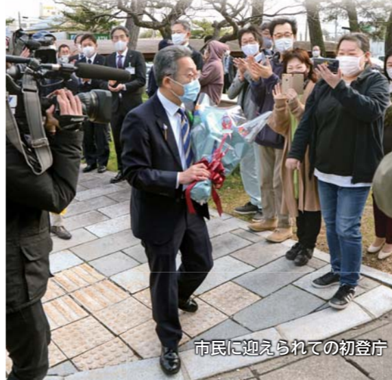
市民に迎えられての初登庁

市長選挙（4月4日投開票）で当選した湊 貴信市長（55歳・岩城二古）が4月19日に初登庁し、職員や市民約300人の出迎えを受けました。就任のあいさつでは職員に対し「市民の要望をより多くかなえるため、まずは聞く姿勢が大事」と呼びかけ、その後行われた会見では「積極的に伺って、市民とじっくり話し合う機会を作りたい」と抱負を語りました。