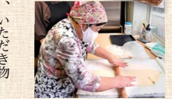
繁忙期にいつも手伝ってくれる母の友人。生地作りも全て手作業。