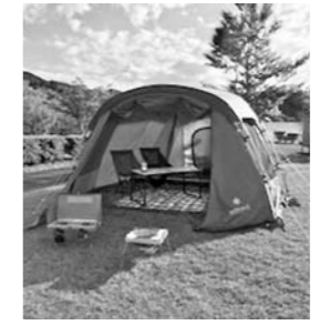
キャンプ用品のレンタルもあります

■八塩いこの森レクリエーション施設 営業中です 54ホールあるパークゴルフ場や、利用時間を拡大してゆつくりと滞在できるようになったオートキャンプ場、広場で楽しむ遊具の貸し出しなどがあります。ぜひお越しください。 営業期間 11月7日(日)まで 問い合わせ 八塩いこの森センターハウス ☎69-2332 ■第37回黄桜まつり 縮小開催します 新型コロナウイルス感染症拡大防止策の検討を進めてきましたが、来場者管理などにおいて万全な対策が難しいと判断し、イベントおよび出店を中止します。なお、自由に桜を楽しんでいただく観桜会期間の「黄桜まつり」とし、灯籠の設置などを行います。 期間 5月16日(日)まで 問い合わせ 市観光協会東由利支部(東由利産業課) ☎69-2116