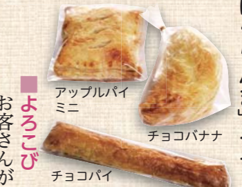
アップルパイ ミニ チョコバナナ チョコパイ