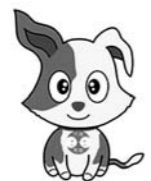
行政相談のマスコット「キクーン」