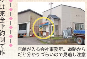
店舗が入る会社事務所。道路からだど分かりづらいので見逃し注意!

ともあり、平成23年2月に自家製アップルパイのお店をオープンさせた。製造・販売を行う店舗は父が経営する会社の事務所内に併設しており、一見お店とは分かりづらいが、窓口ではかわいらしい看板が迎えてくれる。