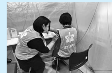
③ 看護師によるワクチン接種。終了後は15～30分の状態観察