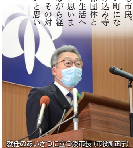
就任のあいさつに立つ湊市長（市役所正庁）

市長選挙（4月4日投開票）で当選した湊 貴信市長（55歳・岩城二古）が4月19日に初登庁し、職員や市民約300人の出迎えを受けました。就任のあいさつでは職員に対し「市民の要望をより多くかなえるため、まずは聞く姿勢が大事」と呼びかけ、その後行われた会見では「積極的に伺って、市民とじっくり話し合う機会を作りたい」と抱負を語りました。