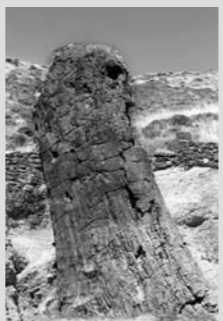
レスポス島を代表するセコイアの珪化木▲

レスポス島はトルコとの国境に位置し、地中海の温暖な気候の下でオリーブの木が生い茂ります。女性たちが経営するレストランへ行くと、島のオリーブを使ったギリシャサラダなどの郷土料理が振る舞われます。そんなレスポス島では約2千万年前の火山活動が活発だった時代、火山灰や溶岩が森を埋め尽くすという出来事がありました。地中に埋まった森は長い年月をかけて化石となりました。その中にメノウやジャスパーなどの宝石になったものもありました。すると、たくさんの人がやってきて、ここから化石を持ち出していったのです。島の貴重な自然遺産が破壊されていたので、国は1985年にこの地域を天然記念物に指定し、保護しました。その後、自然史博物館が建てられ、ここから世界最初のジオパークの一つが誕生したのでした。