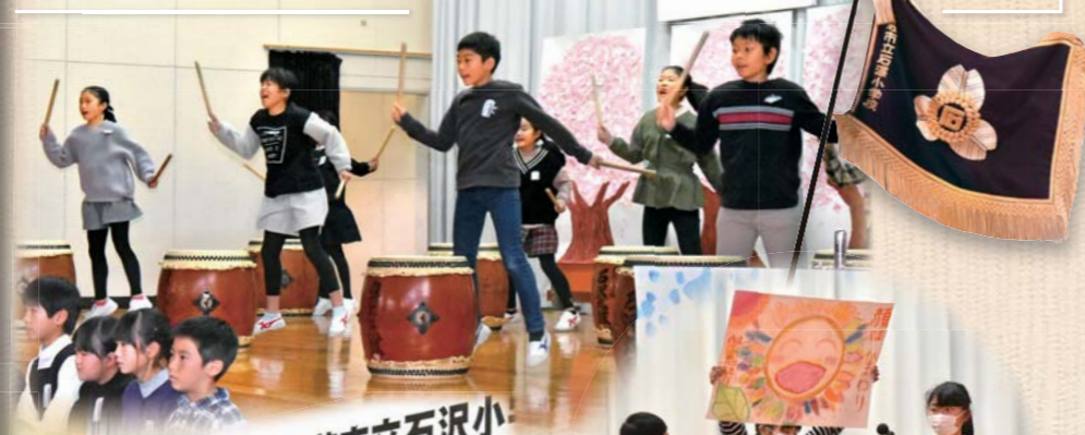
由利本荘市立石沢小 閉校式典 (令和2年11月3日)

みんなで紡ぐ石小校歌 沃野を下る石沢の 清き流にのぞみ 天ぞりたつ海を この空の底の底に 仰ぎまこと年らぬ 恵み受けあめも 自治と理想のあけくた 教える風かめり われらも活動つづ 半ひの道にぞまゐる み空にもとに空は 愛と希望に輝きて 文化の花の咲きほ 強く正しくいゆらん 令和2年11月3日