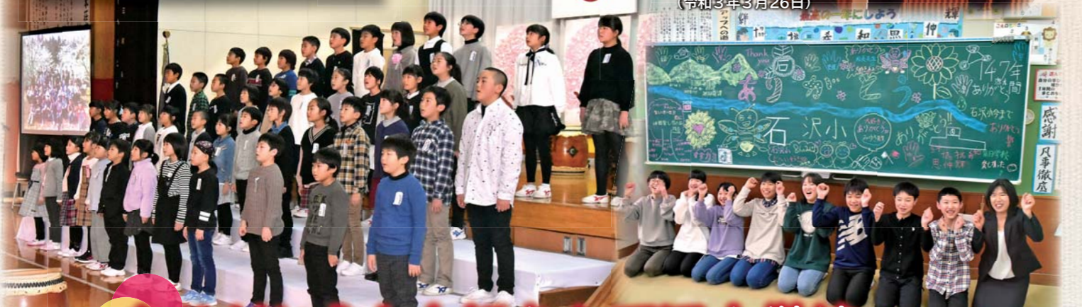
石沢小とお別れする日 (令和3年3月26日)