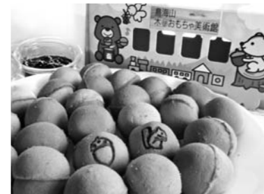
1箱25個入り、1,058円で販売しています。

市、秋田しんせい農協、市商工会が連携した「由利本庄まるごと売り込み推進協議会」では、鳥海山木のおもちゃ美術館をテーマに