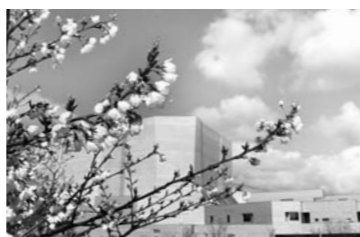
咲き始めた桜とカダレ(4月5日)