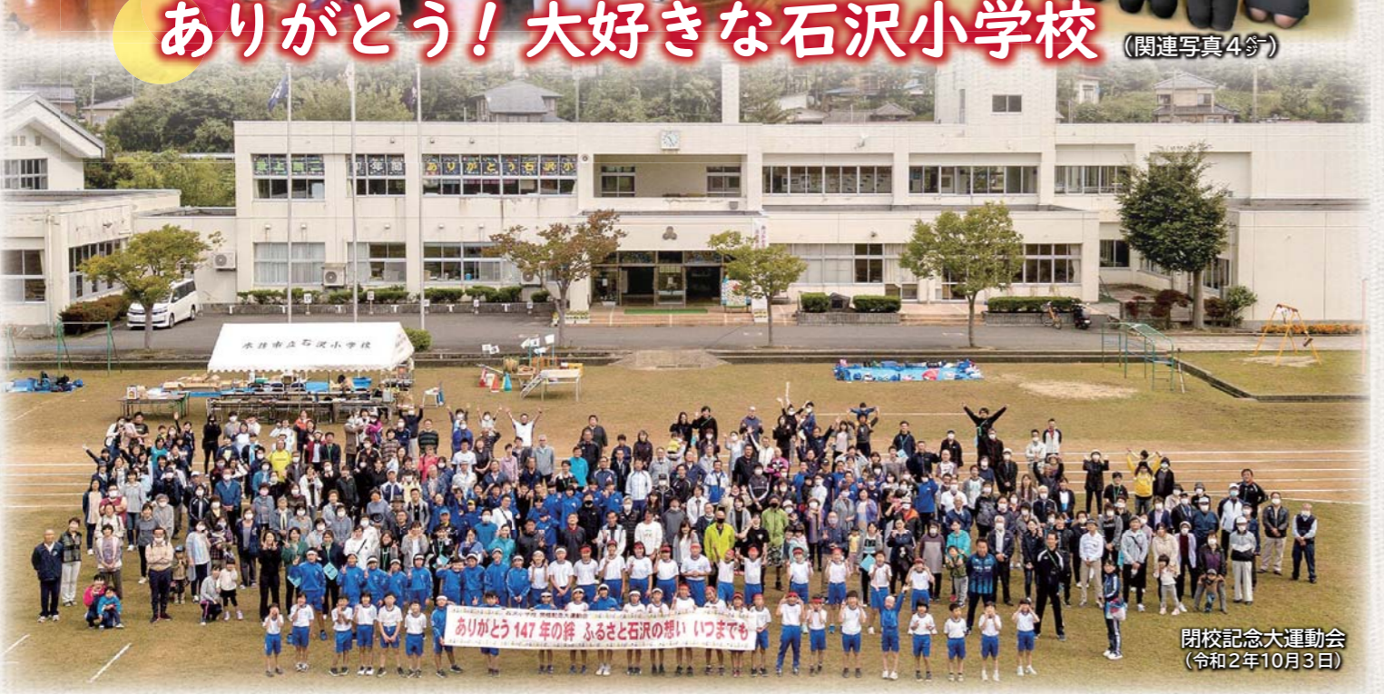
ありがとう！大好きな石沢小学校 (関連写真4分) 閉校記念大運動会 (令和2年10月3日)