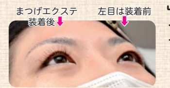
まつげエクステ装着後 ↓ 左目は装着前

■よろこび 「この店が出来たおかげで秋田まで行かなくてもよくなった」「盛岡から本荘に来てくれてありがとう」などお礼の言葉をいただいたとき。コロナ禍のため移住から開店までの苦労は多かったが、ここに来たかいがあったなど実感する。