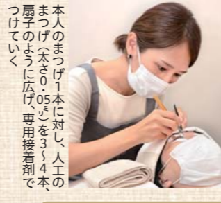
本人のまつげ1本に対し、人工のまつげ(長さ0.05mm)を3〜4本、扇字のように広げ専用接着剤でつけていく

「美容のパーソナライズ化」を念頭に、店内の材料は上質なものを揃え、お客さま一人一人に合わせたその人のためのだけのスタイルを提案する。ヘア部門はカット・カラー・パーマなどの中でも、こだわりのカット技術と縮毛矯正が得意。まつげ・眉部門は、現在のマスク生活では目元の美容に関する需要が高く、メニューも豊富。まつげエクステや次世代まつげパーマが人気で、美眉スタイリングもお任せあれ。