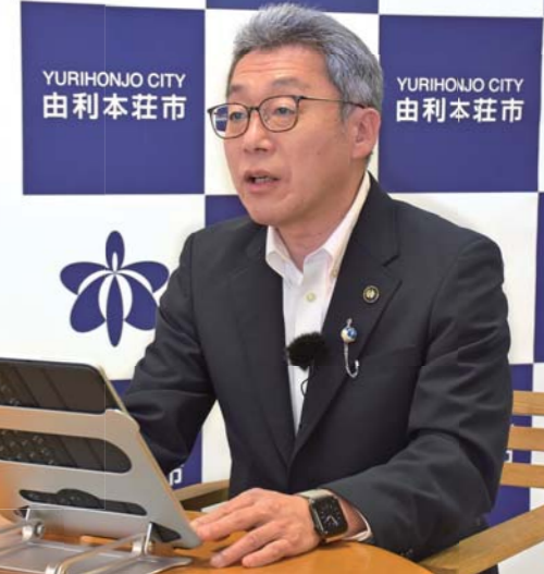
ケーブルテレビ番組「Open!～市長に聞く～」収録中の湊市長