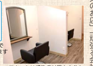
ヘアカットは感染症対策も十分な2席ある半個室で