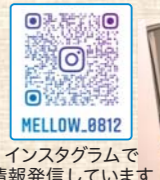
Instagramで情報発信しています