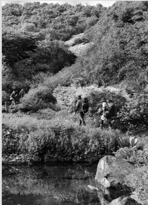
「垢離の池」と矢島口登山道入口

鳥海山の北側、矢島口5合目の祓川神社前に湧水があります。この湧水は、鳥海山のステージⅢ(約2万年前以降)に噴出した七高山溶岩の末端の崖下から湧き出ており、ジオサイトである竜ヶ原湿原の形成要因の一つになったと考えられています。