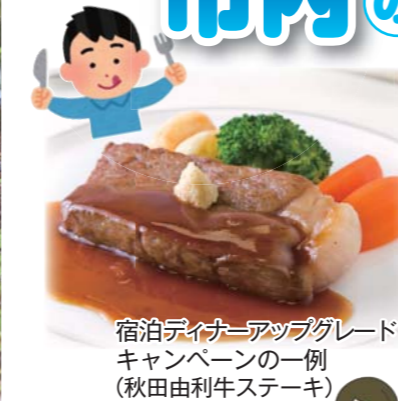
宿泊ディナーアップグレードキャンペーンの一例(秋田由利牛ステーキ)