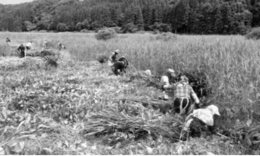
アシの刈り取りなどを精力的に行っていました