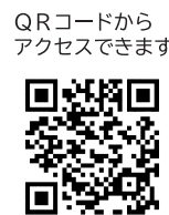
QRコードからアクセスできます

日時 10月28日(水) 給油取扱所講習:9時～正午、一般(その他)講習:13時半～16時半 会場 西目公民館シィガル受講料 4700円 ※なるべく秋田県紙証での納付をお願いします。 申込方法 8月17日(月)から28日(金)まで、(一社)秋田県危険