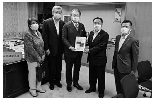
国土交通省御法川副大臣に要望(24日：国交省)