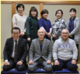
2月17日の例会に参加した皆さん