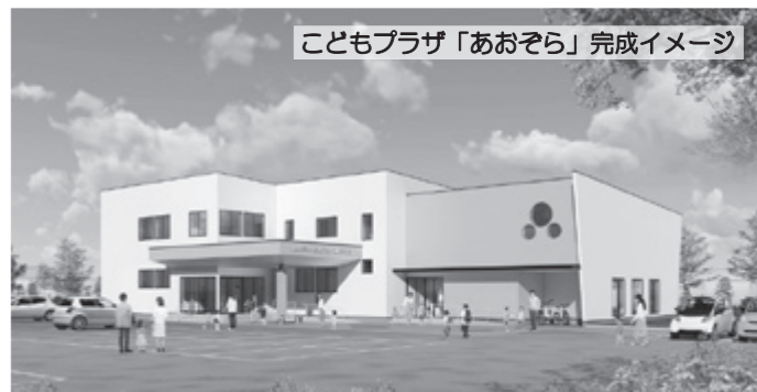
こどもプラザ「あおぞら」完成イメージ