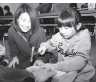
大工道具を使うミニチェアづくり

このうち料理体験教室では、12組24人の親子ペアが参加。香ばしく焼き上げるベーコンチーズブレッド、さまざまなおトッピングが楽しめるパンケーキ、かんぴよう巻きやにぎりずしなどの料理に挑戦しました。