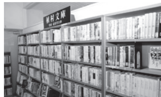
たくさんの図書が並ぶ常設展示「植村文庫」

さんの寄贈品を楽しめる常設展示を設けていますので、ぜひお立ち寄りください。 ※新型コロナウイルス感染拡大防止対策のため3月20日までは閉館予定（3月6日現在）です。