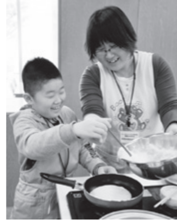
仲良くパンケーキの生地を投入

市商工会青年部が主催する職業体験教室が2月22日、カダーレで開催されました。教室では地元の事業者が講師となり、市内の小学生とその家族が参加しました。この日は「ものづくり体験教室」「料理体験教室」「制服試着体験」の3つの教室が開かれ、たくさんのお親子連れが体験を楽しみました。