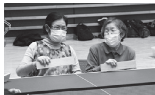
珍プレーや好プレーで和やかに