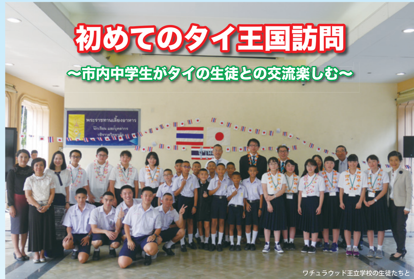
ワチュラウッド王立学校の生徒たちと