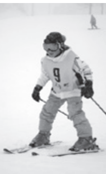
4年生から6年生までの児童54人がスキーを楽しみました