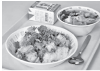
おいしそうなすきやき丼