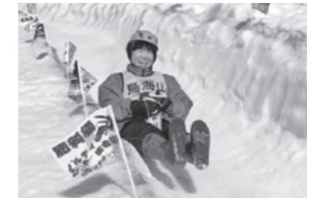
大人も子どももみんな挑戦しましょう!