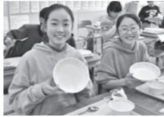
ペロリと平らげました!