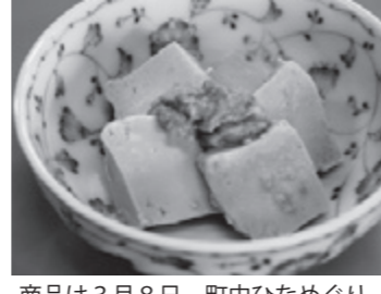
商品は3月8日、町中ひなめぐりの開始に合わせて矢島駅で販売

ために塩分を抑えつつ消費者ニーズにも応えられるように最終調整したい」と気を引き締めていました。