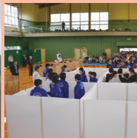
避難所運営訓練（10/5 由利体育館）