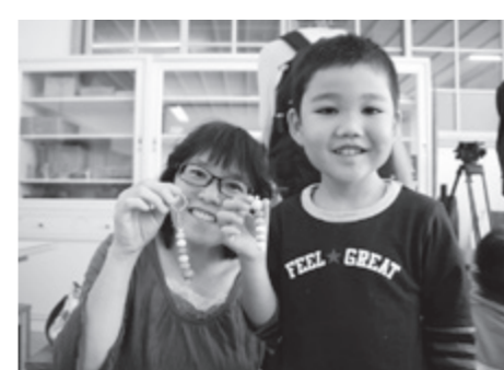
ひっつきむしの完成