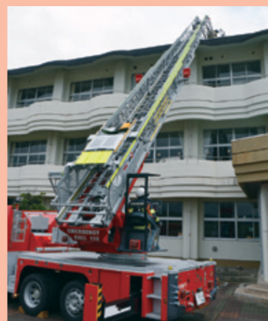
建物火災防御訓練（10/5 由利中学校）