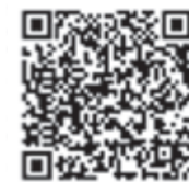
1詳しくはこちらから

日時 11月17日(日) 10時~16時半 会場 秋田テルサ(秋田市御所野)ホール&体育館 内容 作品コンクール表彰式、ふれあいカード優良協賛店表彰式、講演会、トークショー、協賛22店の楽しいブース、わくわくステージショー(おしりたんていほか) ① 秋田県次世代・女性活躍支援課 ☎018-860-1553