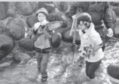
遊佐町「鮭のつかみどり大会」

すごし、およそ四年後に生まれた河川に帰ってきます。約1万キロにもおよぶ長旅です。