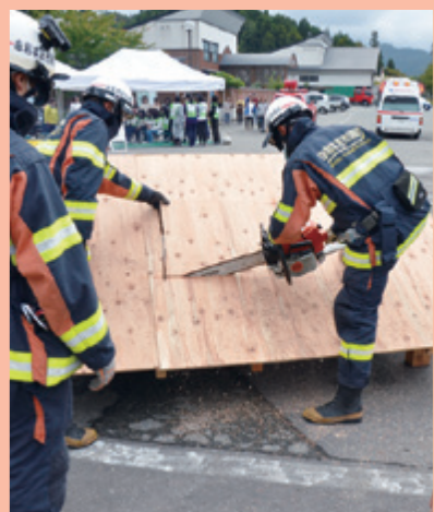
倒壊家屋からの救出訓練（10/5 善隣館）

長谷部市長は閉会式で「本日の訓練は皆さん真剣に、積極的に取り組んでいただき、大変有意義だったと感じています。市では『災害に強いまちづくり』に向けて、総合防災公園をはじめとした施設整備のほか、消防団や自主防災組織の育成・強化などソフト面の充実も図り、防災体制の強化に努めてまいります。今回の訓練を機に、災害に対する危機意識を一層高めていただき、今後も防災・減災の取り組みにご協力をお願いします」と訓示を述べました。