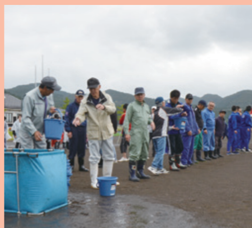
バケツリレーによる消火訓練（10/5 由利小学校）