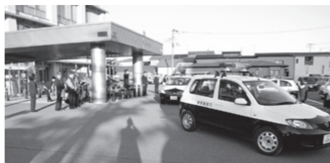
出勤する防犯パトロールカー