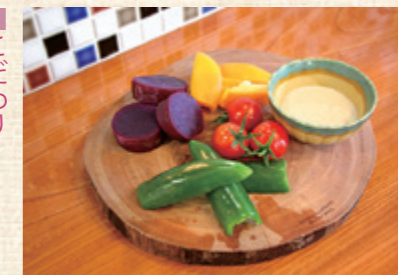
左部農園野菜のバーニャカウダ。この日はミニトマト、黄ピーマン、こどもピーマン、紫芋。

このコーナーでは、市商工会に加盟している市内各地域の「人気のお店」、「頑張る会社」を紹介いたします。今回は、本荘地域の「マナイタ」です。