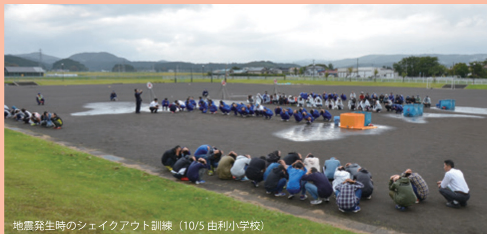
地震発生時のシェイクアウト訓練（10/5 由利小学校）

10月12日から13日にかけて、台風19号が日本各地に甚大な被害をもたらしました。災害からの被害を最小限に抑えるには、地域で助け合う「共助」の力が欠かせません。日頃から共助による防災活動の意識を高め、災害に備えましょう。