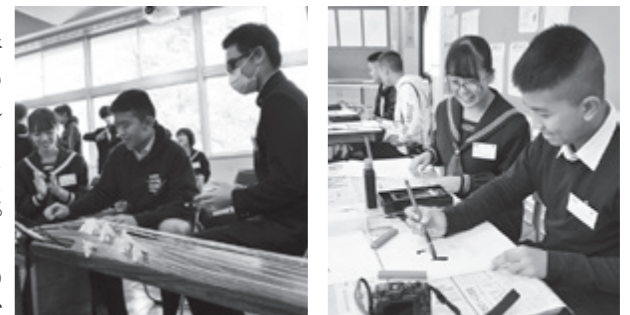
筆の演奏と書道の体験(17日・大内中)

も行われました。この後、タイ王国の生徒と大内中の3年生が4つの教室に別れ、交流授業が行われました。