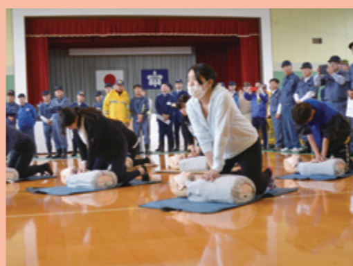
応急手当訓練（10/5 由利体育館）

訓練は、午前8時に北由利断層を震源とするマグニチュード7・3、震度6弱の大地震が発生したとの想定で実施。地震発生時に身の安全を確保するためのシェイクアウト訓練、バケツリレーによる消火訓練のほか、避難所運営訓練、炊き出し訓練、救助救出訓練などが地区内の各所で順次進行され、約2時間にわたり迅速かつ的確に訓練が繰り返されました。