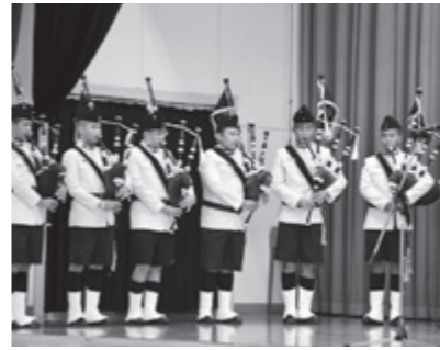
バグパイブ演奏(17日・大内中)

17日、一行は大内中学校を訪問し、普段は国王の前でしか行わないというバグパイブ演奏を披露。大内中の生徒たちは勇壮な音色に聞き入っていました。次は大内中の生徒がお返しにソラン節を披露したほか、科学部による「音」をテーマにしたサイエンスショー