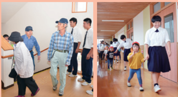
町内会・保育園・高校が連携した合同避難訓練（10/4 由利高校）

10月4日には、川口町内会と内越保育園、由利高校の合同避難訓練が同校で実施され、地震や津波発生時の避難経路や協力態勢について確認しました。