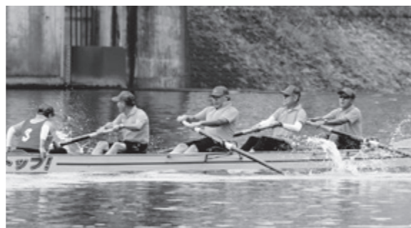
力漕する市議会子吉川クルー

全国市町村交流レガッタ日田大会 市議会子吉川クルーが全国優勝 第28回全国市町村交流レガッタ日田大会が9月28日と29日、大分県日田市の三隈川特設会場で開催されました。 大会には26自治体から124クルーが出場。議会議員の部では、本市代表の「由利本荘市議会子吉川」が7年ぶり7度目の優勝を果たしました。 本市からは市議会子吉川を含め8つの部門に8クルーが出場し、全クルーが決勝進出と入賞を達成。自治体ごとの総合成績では男女総合で2位、女子総合で4位と目覚ましい活躍を見せました。 ▼各部門のレース結果 ▼議会議員・優勝：由利本荘市議会子吉川 ▼成年男子・準優勝：悪友会 ▼壮年男子・第3位：本荘由利森林組合B ▼成年女子・第4位：本荘由利森林組合L ▼議会議員シニア・第5位：由利本荘市議会鳥海山 ▼壮年女子・第6位：山ゆりほんレディース ▼熟年男子・第6位：それれ楠引 ▼熟年女子・第6位：ナイスキャッチーズ