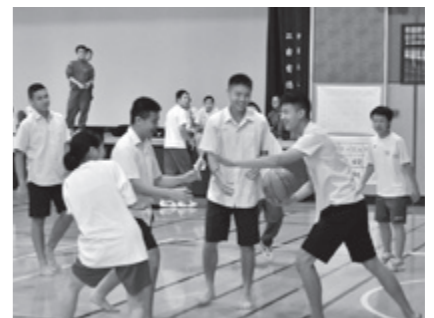
バスケットボール(18日・岩城中)

来月1月、教育交流の一環として、今度は本市の中学生10人がタイ王国を訪問します。その訪問団の一員