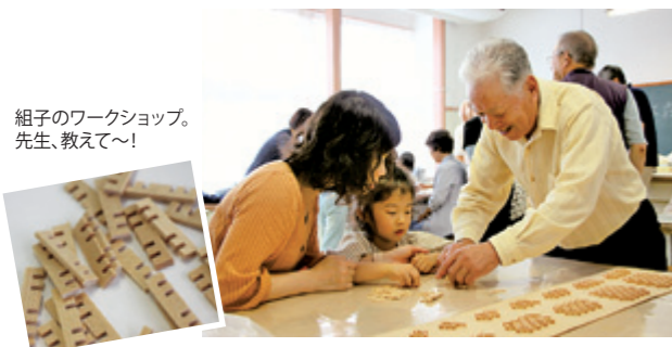
組子のワークショップ。 先生、教えて〜！