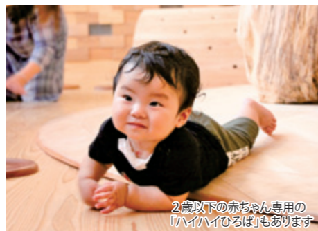
2歳以下の赤ちゃん専用の 「ハイハイひろば」もあります