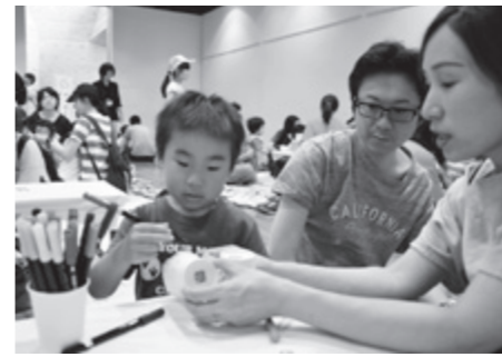
紙コップバルーンを手作り

やを楽しむコーナーや手遊びと体操でふれあうコーナー、読み聞かせなどの多彩な催しが行われ、多くの親子連れが交流を楽しんでいました。