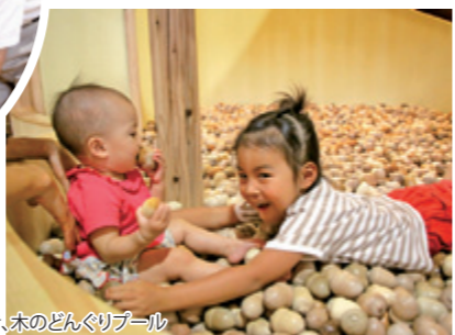
みんな大好き、木のどんぐりボール