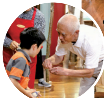
こま回しの技を習って 達人を目指そう！