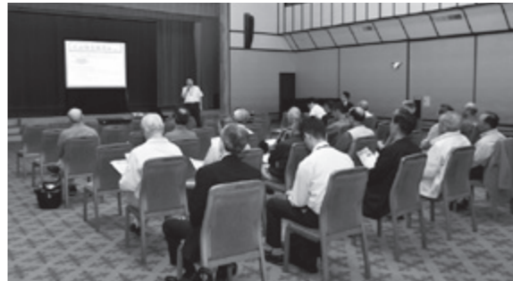
紫水館での説明会

鳥海山火山防災マップ説明会 火山災害の危険性や避難の必要性などを理解してもらうことを目的に作成された「鳥海山火山防災マップ」についての説明会が、6月12日に矢島地域の日新館と鳥海地域の紫水館で開催されました。 鳥海山火山防災マップは、秋田県や山形県をはじめとする関係市町村などで構成された鳥海山火山防災協議会が作成したものです。鳥海山が噴火した場合に災害が及ぶ危険性のある区域や