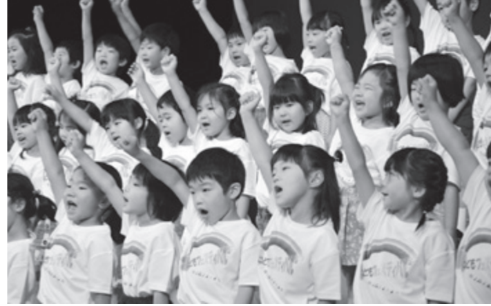
元気いっぱいに歌を披露する園児たち

やを楽しむコーナーや手遊びと体操でふれあうコーナー、読み聞かせなどの多彩な催しが行われ、多くの親子連れが交流を楽しんでいました。