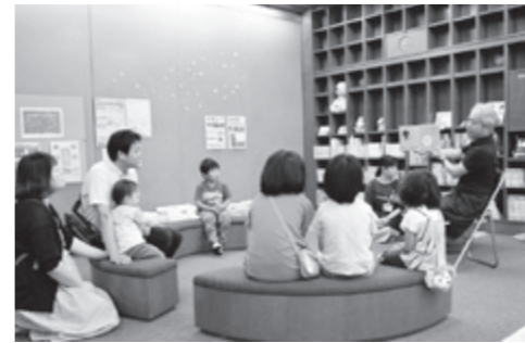
図書館で読み聞かせ