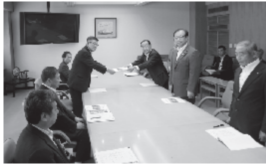
佐竹知事へ要望書を提出(13日:県庁)

6月13日(木)、17日(月) ○市と市議会との合同要望 (県内、仙台市、東京都)