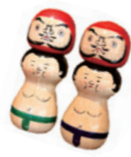
ブローチやピアスも人気

恐竜や動物などの定番モチーフのほか、だるまや力士、どくろ、宇宙人などバラエティー豊かな面々がずらり