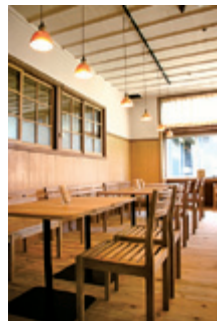
木のぬくもりがあふれる店内

入館料なしでも利用することができる食事スペース。地元の素材を大切にした手作りの味が自慢です。不動の人気は写真の「おむすびころりん」。本荘うどんやゆり根うどん、ミルジーの牛乳、ゆり支援学校の生徒が作るジャムなど、由利本荘の「おいしい」が集まっています。