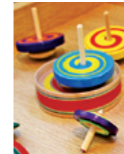
大人だけの参加も大歓迎。いろんな世代で楽しみましょう！

2年目を迎え、土日はこども劇場で毎週イベントを開催します。学芸員プログラムとして、昔遊びコーナーなど子どもも高齢者もみんなが笑顔になってくれるような催しを予定しています。