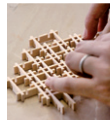
組子のコースター作り

「木の仕事と木エワークショップ」を始めました。月に1回程度の開催で、由利本荘市に住むプロの木工作家を講師に迎え、こけしの絵付けや絵馬作り、箸作りや木のスプーン作りなど、さまざまなものづくりに挑戦できます。