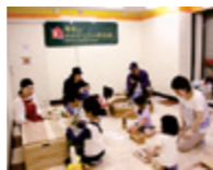
羽後本荘エキまつりで

地元の職人が製作した木のおもちゃなどがたくさん詰まった木箱を市内で開催されるイベントなどに貸し出す取り組みを始めました。