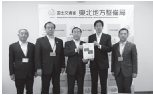
東北地方整備局長へ要望書提出(17日:仙台市)