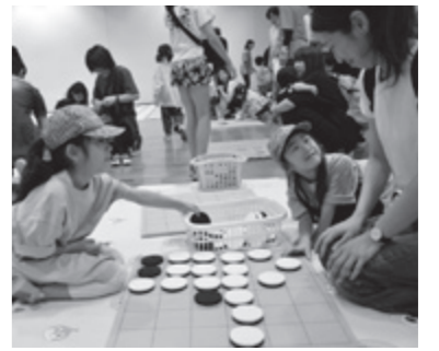
オセキにチャレンジ