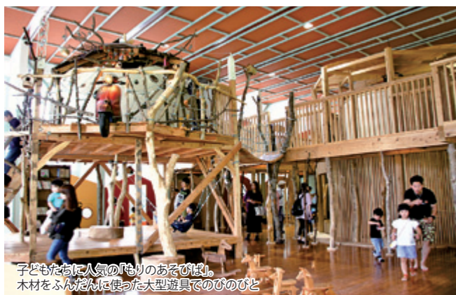
子どもたちに人気の「木のおそびば」 木材をふんばんに使った大型遊具でのびのびと

地域の木材と人材で活気を生み出してきた美術館は、開館から2年目に突入しました。1年目も季節ごとのイベントを開催するなどして工夫を凝らしてきましたが、2年目は若い親子世代だけでなく高齢者世代の方々にも楽しんでもらえるような取り組みに力を入れ、さらにパワーアップして皆さんをお迎えします。次のページでは、1年経ってリニューアルしたところ、新たな試みなどを紹介します。