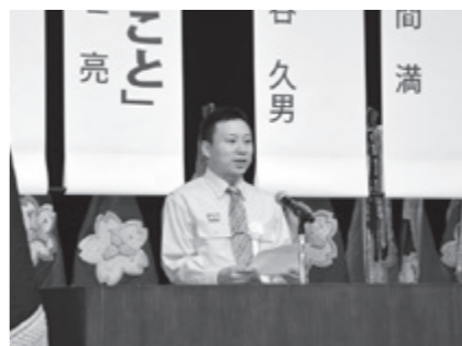
意見発表をする消防団員