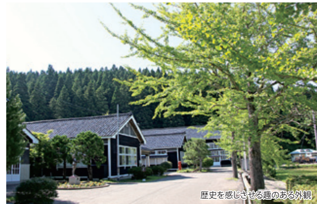
歴史を感じさせる趣のある外観