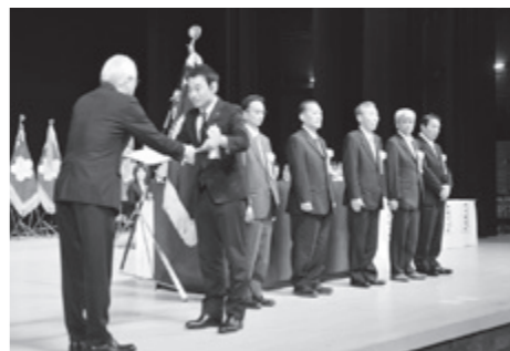
表彰を受ける優良事業所の皆さん