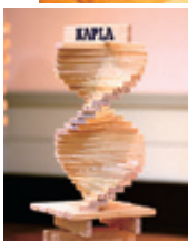
作っているときも、 崩れてしまうときも、 楽しいんです