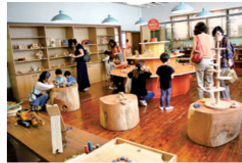
見て楽しく、遊んでみるとさらに楽しいおもちゃがいっぱい