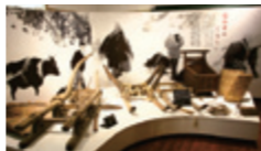
わら細工や木のそりなどが並びます

民具展示室には、ちょっと昔の由利地域の人々が日々の暮らしで使っていた物を展示しています。タイムスリップしたような気分が味わえます。