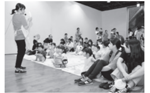
エプロンシアター