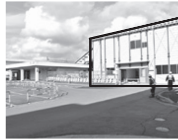
建設中の仮駅舎(太枠部分、5月22日撮影)

市では、JR東日本と工事協定を締結し、駅東西を行き来できる「東西自由通路線」の整備を進めています。この工事に伴い、現在の駅舎から仮駅舎（南側隣接）での営業に切り替わります。 工事期間中はご不便をおかけしますが、ご理解とご協力をお願いいたします。 切り替え開始日時 6月15日(土) 朝5時 ※現在の駅舎での最後のイベント「羽後本荘エキまつり2019」については、17ページに掲載しています。