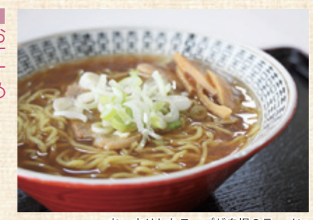
あっさりしたスープが自慢のラーメン

このコーナーでは、市商工会に加盟している市内各地域の「人気のお店」、「頑張る会社」を紹介しています。今回は、鳥海地域の「キッチン山河」です。