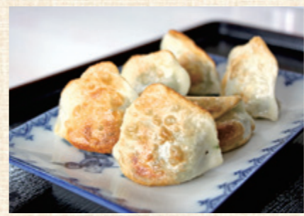
カリッと焼き上げたギョーザ。ころんとした形も特徴

メニューにはラーメン類や定食、チャーハン、カレーライスのほか、ギョーザやホルモンの煮込み、みそ汁などが並び、どれも手頃な価格。一部のメニューは弁当にして持ち帰ることもできる。 ラーメンはシンプルで「中華そば」スタイルで、スープがおいしいと好評。鶏をベースに昆布やたつぷりの野菜、豚骨などでだしをとり、あっさりした味に仕上げている。 ラーメンと一緒におすすめしたいのがギョーザ。外側はカリッと、中はしっとりした食感で、具材のニラ