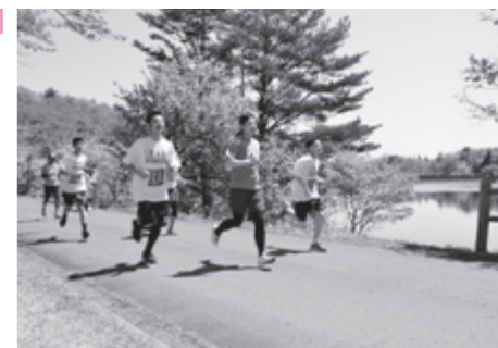
湖畔を快走するランナー

この日は他にも野点茶会や魚のつかみ取り、黄桜歌謡ショーなどのイベントが行われ、絶好の行楽日和のもと多くの家族連れでにぎわいました。