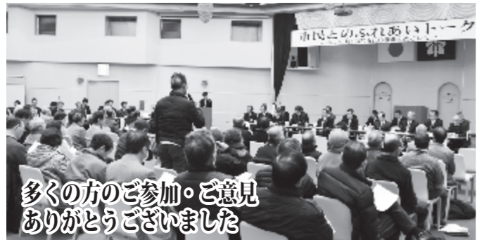
多くの方のご参加。ご意見ありがとうございました

Q 団員の確保については、消防団協力事業所制度や機能別消防団員などの各種制度を活用しながら取り組んでいるが、増加に至らず苦慮している。消防団の再編については、各分団で班の統合の動きが増えており、今後考慮する必要がある。