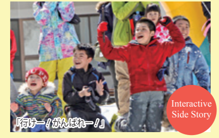
Interactive Side Story

場に目を細めました。カーブでひっくり返ったり猛スピードでゴールを切ったりと、1人1人が滑るたびに沸いた大会。青空の下に白い雪と参加者の笑顔がまぶしく輝き、活気に満ちた1日となりました。