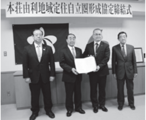
左から渡部市議会議長、長谷部市長、市川にかほ市長、佐藤にかほ市議会議長

本市とにかほ市が12月25日に「本荘由利地域定住自立圏形成協定」を締結しました。