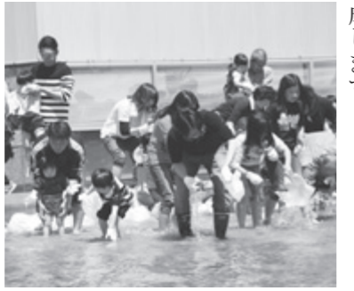
事業活用団体のイベントの様子

市民団体などが行う、地域の文化・交流・観光事業や地域づくり・イベント事業に助成します。 入札日時 1月31日(木) 10時～12時 ※10時に会場にいない場合は辞退したものとみなします。 入札場所 市役所正庁 問い合わせ先 管財課 ☎24-6262