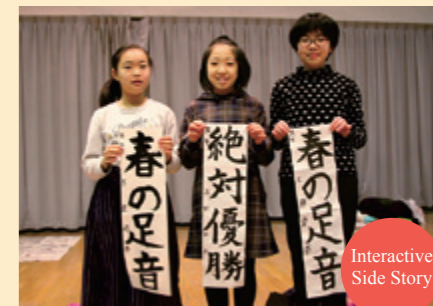
Interactive Side Story

対優勝」という文字を何度も書き込み「バドミントンの大会で優勝するのが目標。今まで得意にしていた守りだけでなく、今年は攻めるバドミントンをがんばりたい」と決意を新たにしていました。