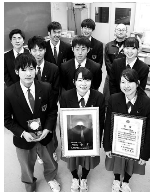
西目高校農業科学系列生徒たちの努力実る！