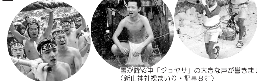
雪が降る中「ジョヤサ」の大きな声が響きました(新山神社裸まいり・記事8頁)

2月 乳幼児健診 ○母子健康手帳・アンケート票・バスタオルを忘れずにお持ちください ○事前に健診の準備が必要ですので、該当する地域で受診してください ○3歳児健診を受ける方は、ご家庭でアンケート票の中の聴力と視力の検査をしてきてください ○本荘地域と西目地域の7カ月児健診は個別受診となります ○当日受診できない場合や不明な点がある場合は、当該地域の保健センターまたは市民福祉課へご相談ください