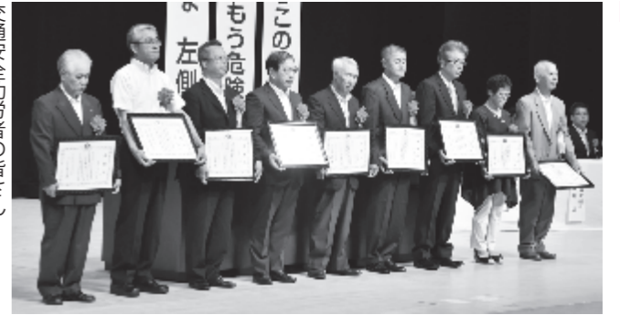
交通安全全功労者の皆さん

第14回交通安全市民大会が7月26日にカダーレで開催され、市民約800人が参加しました。