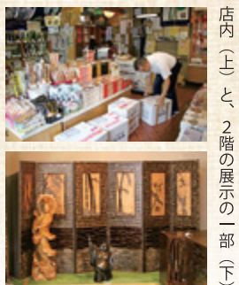
店内（上）と2階の展示の一部（下）

■これから 店で待っているだけでなく、イベントに出店したり外に出て行ってPRしたりということにも力を入れていきたい。季節の贈答品などもいろいろ用意している。帰省客だけでなく地元の人たちにも足を運んでもらえるよう頑張りたい。