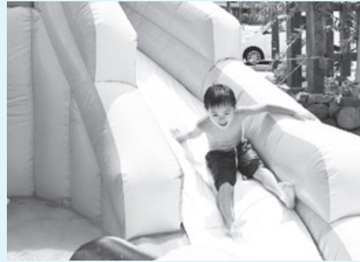
滑り台やビニールプールで遊ぶ子どもたち