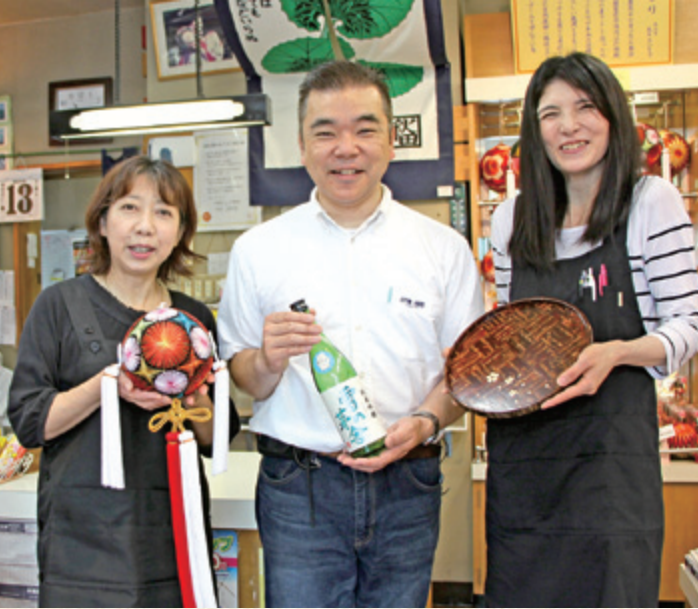
民芸品、地酒、お菓子…いろいろそろえてお待ちしております！

大門公園で7月22日に「大門ウォーターパーク」が行われました。大型ビニールすべり台やさまざまなビニールプールが用意された会場では、市街地での水遊びを楽しむ子どもたちのにぎやかな歓声が響きました。