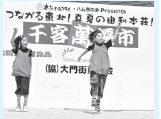
ステージではダンスショーも行われました