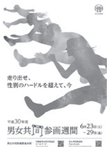
走り出せ、性別のハードルを超えて、今