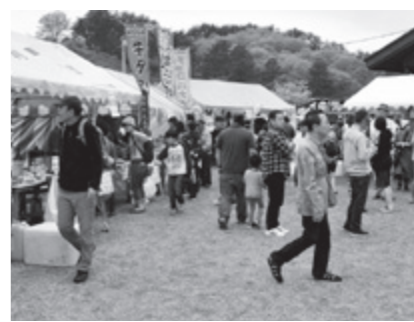
多くの人でにぎわう「グルメ横丁」

黄桜まつりのイベントデーが5月13日、八塩いこいの森で行われました。黄桜まつり健康マラソンには、14種目に290人が参加。小学生男女3年生以下