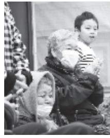
がんばる子どもたちの姿に笑顔が広がりました(表紙参照)

◆由利本荘春の花巡りのスタンダート「完全制覇」を目指してがんばります。数年前に鳥海高原菜の花まつりに行きましたが、坂の上から見た黄色のじゅうたん、とてもきれいでした。会場でも運営に携わっていた大学生の元気な姿を見て、私も