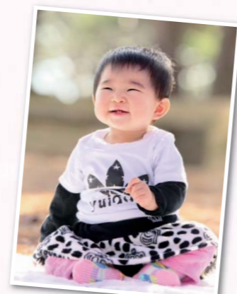
皆さんから寄せられた「笑顔の写真」！（20ページに続きます）

明けましておめでとーございます たくさん笑顔に囲まれ、明るい一年でありますように