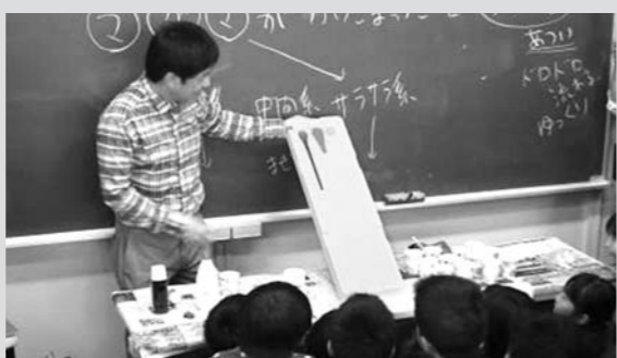
小学校での出前講座の様子