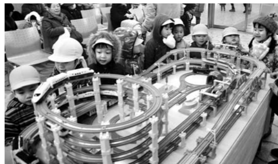
人気を集めたブラレール展示(上)とペーパークラフト製作体験(下)