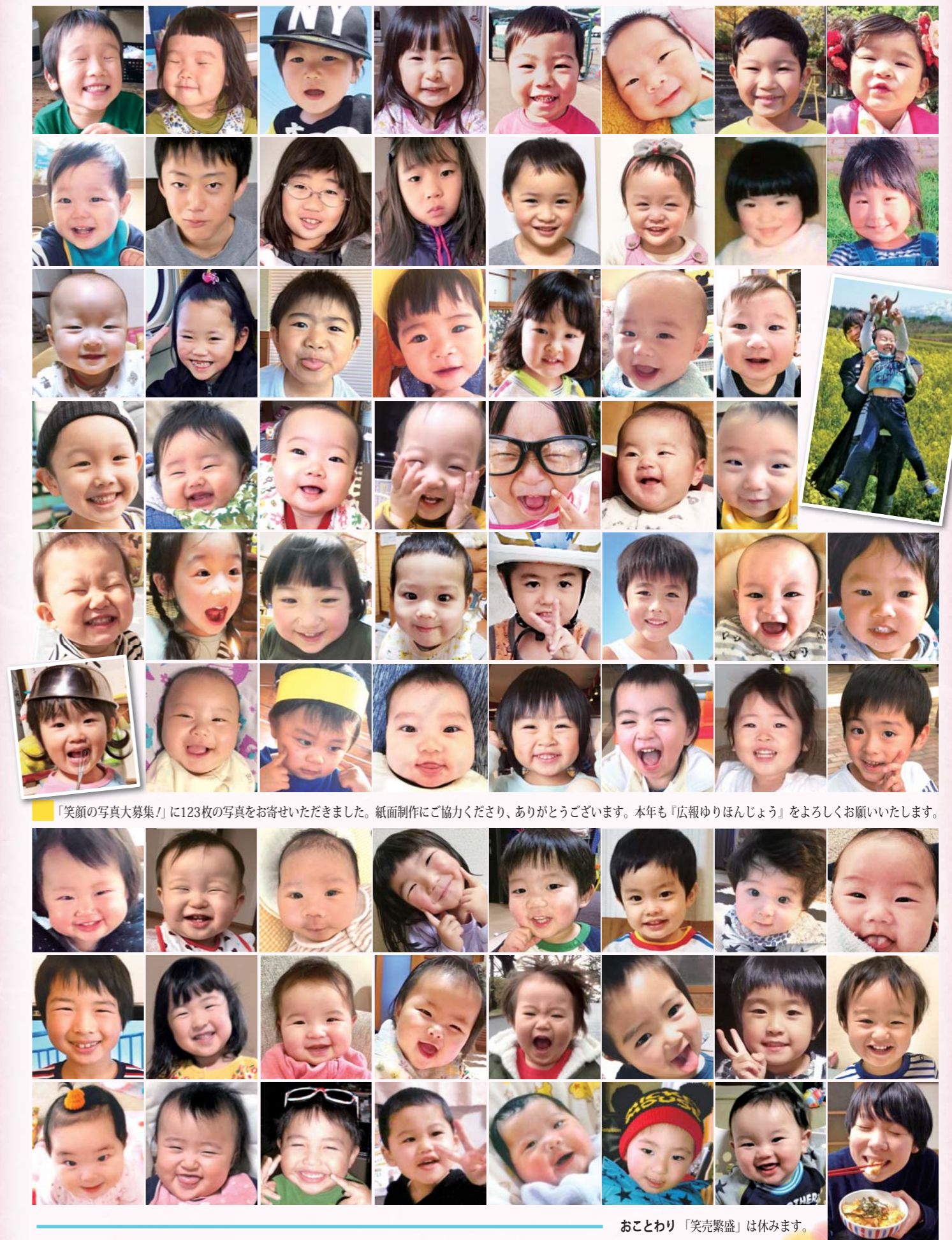
「笑顔の写真大募集！」に123枚の写真をお寄せいただきました。紙面制作にご協力くださり、ありがとうございます。本年も『広報ゆりほんじょう』をよろしくお願いたします。