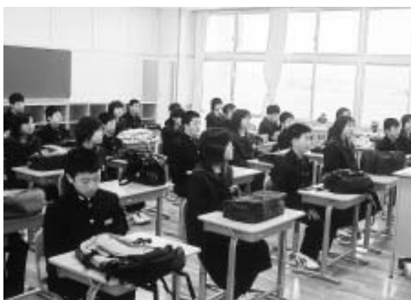
真新しい教室に入った新入生

このほか屋外には、運動場、テニス コート、多目的広場を配置し、常設七 十台の駐車場も備えています。