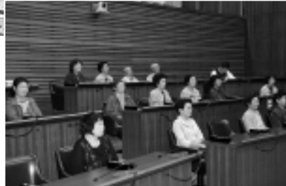
議場ではちょっぴり緊張

1市7町が合併して誕生した由利本荘市。県内随一の広さを誇る本市には、それぞれの地域の史跡や観光スポットなどが、たくさんあります。