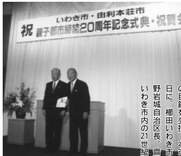
記念品の目録を交換