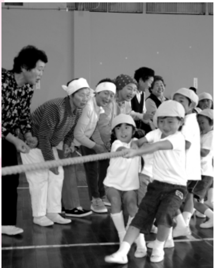
（9月29日「本荘地区老人と園児の集い」で）

保育時間は午前七時～午後六時（矢島は午後七時）で、利用料金は一日二千円（食事代は別途。所得税非課税世帯は千円。市民税非課税世帯と生活保護世帯は無料）。日・祝祭日、年末年始はお休みです。