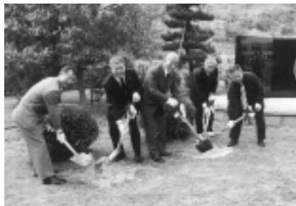
本市からのツツジをいわきの地に植樹