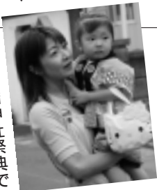
本荘八幡神社祭典で

ここで生まれ、育つ子どもたちと、子育てに頑張る保護者の、輝く笑顔の輪が広がることを願いながら―。