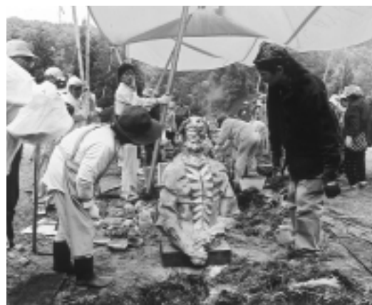
焼き上がった武者像に見入る人 (9月16日、全県野焼きを楽しむつどい = 東由利八塩いこいの森)