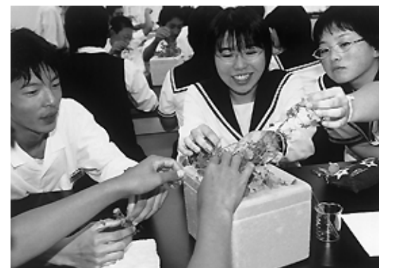
シロツメグサの根粒の窒素を測定