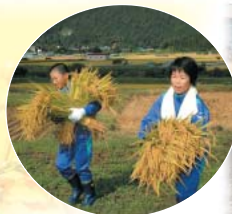
全員のチームワークで作業を進める児童

松くい虫被害などで失われた松林の再生を目的とした、市と県由利地域振興局主催の第3回秋田県森林祭が10月1日、西目地域の浜山海岸保安林地内で開催されました。 さわやかな秋晴れとなったこの日は、市内外から家族連れや小中学生など、約500人が参加。開会式で植樹の説明を受けた後、参加者らは、移植ベラで砂を掘りクロマツの苗木をやや深植えにして、足でしっかりと根元の砂を踏み固め、丈夫で美しい松林が再生するよう願いを込めてクロマツの苗木約3,000本を植樹しました。