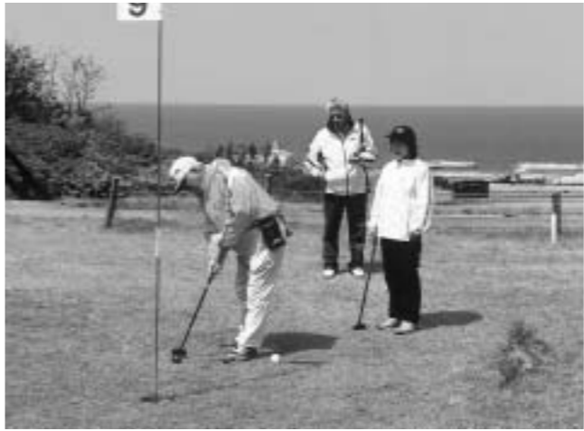
健康な生活を送るために...

老人保健と国民健康保険には、入院時の医療費や食事代の負担を軽くする制度があります。