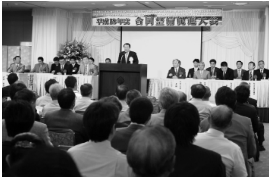
日本海沿岸東北自動車道建設促進秋田県南部期成同盟会／羽越本線新幹線直通促進秋田地区期成同盟会／鳥海ダム建設促進期成同盟会／本荘由利交通体系整備促進協議会／（仮称）松ヶ崎亀田インターチェンジ設置促進期成同盟会／子吉川治水期成同盟会

明るく住みよい地域づくりは、私たちの大きな願い——。特に、道路・交通体系は、身近な暮らしを支える一番の基盤です。道路、鉄道などの各期成同盟会による「合同整備促進大会」と、新潟・山形・秋田3県の「羽越本線高速化シンポジウム」が開催され、早期実現に向けた地元の強い願いを示しました。市では、時代に即した社会資本の着実な整備を目指し、引き続き、懸命な取り組みを重ねてまいります。