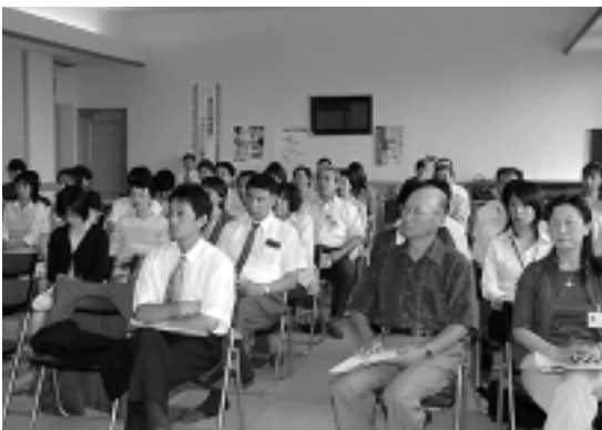
2人の講演に熱心に聞き入る参加者