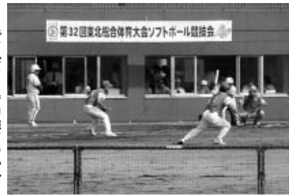
スピーディーで力強さあふれるソフトボール競技

ソフトボールの魅力は、なんと言っても試合の展開がスピーディーなことでしょう。それは、野球と比べて塁間・投球距離が短く、その分ピッチャーの球速は大変早く感じられ(実際の球速は男子で時速約百二十キ、女子で約百キ)走塁もスピーディーです。 また、カーブ・シュート・ドロップ・ホームプレート付近で浮き上がるライズボールやチェンジアップといった、多彩な変化球も見どころの一つです。 ソフトボールリハーサル大会は、九月二十二日(金)から二十四日(日)、全日本総合女子ソフトボール選手権大会が行われます。この大会は、日本のトッププレーヤーが集まります。各選手の磨き上げられた力強いピッチ