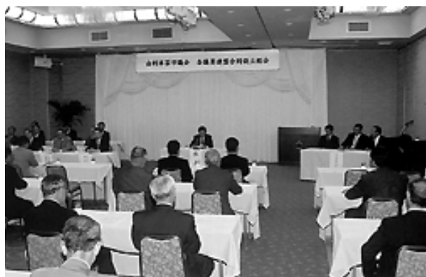
満場一致で案件を承認

「産業活性化議員連盟」は、景気低迷の中で苦境に立つ農水産業や商工業の現状を把握し、振興策の研究や関係機関への提言などを行うことで、より一層地域産業の振興、活性化を図るのが目的。「スポーツ振興議員連盟」は、人生をより豊かにし、心身両面の健康の保持増進や、活力ある健全な社会の形成にも貢献する