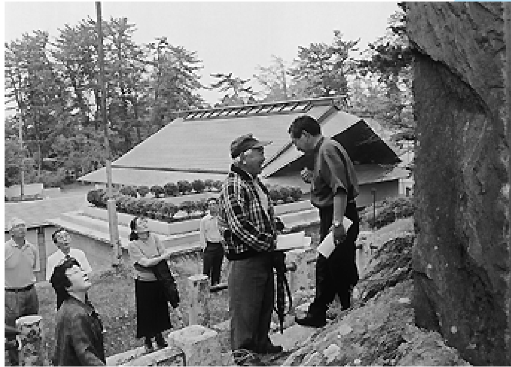
大きな石碑を見上げる参加者

本荘公園内にあるたくさんの石碑や記念碑の由来、建立にまつわるエピソードなどを聴きながら、郷土の歴史に理解を深める本荘公園の石碑探訪会が7月1日、行われました。