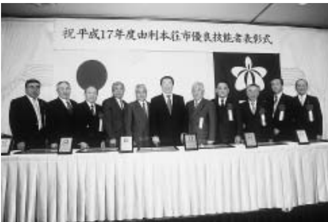
優良技能者表彰を受けられた皆さん