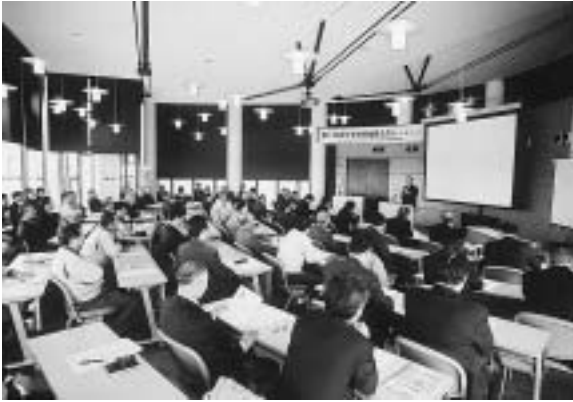
産学官から関係者が多数出席