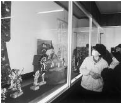
優雅で気品に満ちた「お雛さま展」好評開催中

このほど、鳥海地域笹子地区の多目的活性化広場(鳥海町上笹子)に、宝くじ助成事業により、すべり台とチェーンネットからなるコンビネーション遊具やスプリング遊具、ベンチなどが設置されました。この事業は、(財)自治総合センターが宝くじの事業収入を財源として、市町村等のコミュニティの健全な発展を図ることを目的として行われているもので、地域振興の一層の充実に役立つものと期待されます。