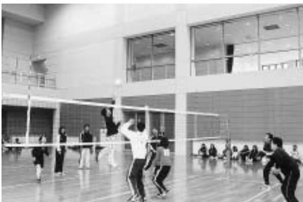
夫婦ならではの息の合ったプレー

本荘郷土資料館や亀田佐藤八十八美術館、岩城歴史民俗資料館で同時開催中のおひなさま展を、バスで巡る初の企画、「雛ツアー」が三月三日開催されました。七十人の参加者は、三館合わせて数百点にも及ぶひな飾りや、表情豊かなおひなさまを眺めては、一足早い春を感じ、心穏やかな様子でした。