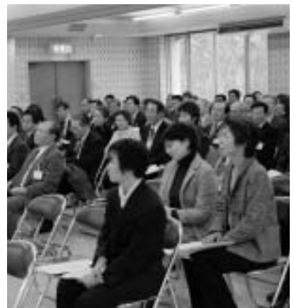
熱心に聴き入る皆さん