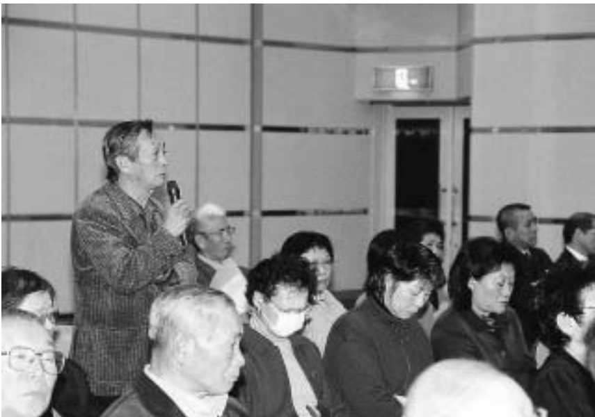
質問する市民（大内地域で）

市では今後も、市政懇談会などを通じて、市民の皆さんとの共通認識を持ちながら、よりよいまちづくりを推進していきます。