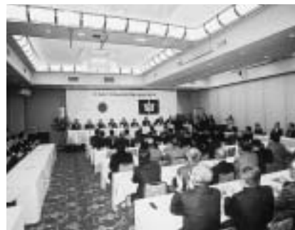
表彰式会場の様子

長年にわたり同一職種に精励されている優秀な技能者をたたえらるるにも、技能人材の育成を支援しようと、平成十七年度由利本荘市優良技能者表彰式が二月二十八日、市内のホテルで開催され、十人の皆さんに表彰状が贈られました。表彰された皆さんは次のとおりです。