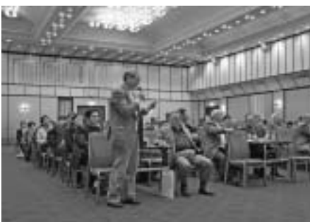
鳥海地域の会の様子