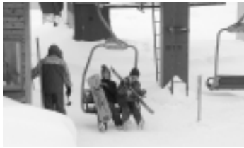
鳥海高原 矢島スキー場