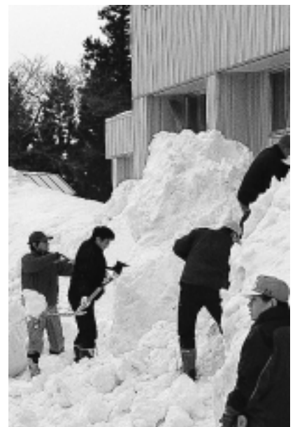
屋根の雪を下ろして4 m以上の高さになった雪をよせる保護者の方々（直根小学校体育館脇）

市では昨年十二月二十六日に設置した「由利本荘市雪害対策本部」を、本年一月六日「由利本荘市豪雪対策本部」に切り替え、各方面と連携しながら、市民の皆さまの協力のもと、安全な生活が確保できるように取り組んでいます。