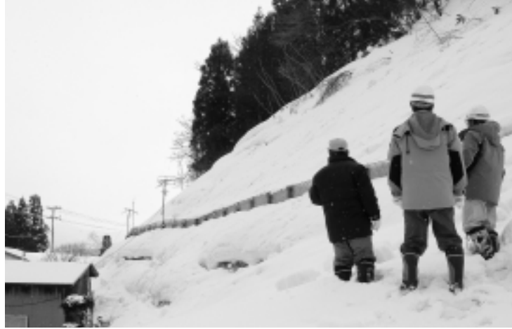
雪崩危険箇所パトロール（矢島地域）

市では昨年十二月二十六日に設置した「由利本荘市雪害対策本部」を、本年一月六日「由利本荘市豪雪対策本部」に切り替え、各方面と連携しながら、市民の皆さまの協力のもと、安全な生活が確保できるように取り組んでいます。