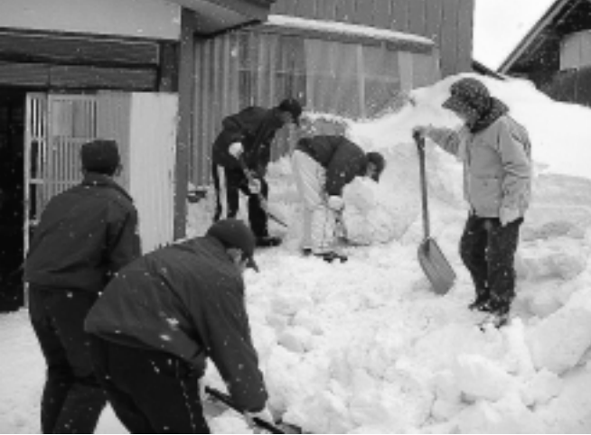
鳥海中学校野球部員が高齢者宅の雪よせ奉仕