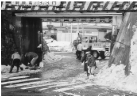
住民の協力を得て一斉除雪（岩城地域）

市雪害対策本部の設置と同時に、市では行政協力員や町内会長、消防団などを通じて、地域の見回りや安全確保の協力をお願いしています。また、冬季休業あけで小、中学生の登校が始まる前に安