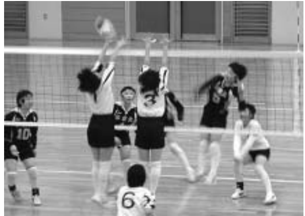
熱戦を繰り広げる選手(本荘北中 対 本荘東中戦)

大会には、東北と新潟からの強豪校6チームと、県内から各大会の上位成績校10チームが出場。本荘由利地域からは、本荘北中学校、本荘東中学校、由利中学校、鳥海中学校、出羽中学校、仁賀保中学校の6チームが出場し、熱戦の末、本荘北中学校が本市勢では本大会初めての優勝に輝きました。