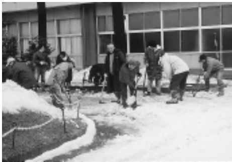
保護者による鶴舞小学校玄関前の除雪作業

全のため除雪作業が困難な場合に、家屋の出入り口確保の除雪をシルバー人材センターに委託し、費用の一部を助成しています。また、屋根の雪下ろし費用の支払いが困難な高齢者世帯等についても、助成する制度があります。対象となる方や助成内容等、詳細については長寿支援課（24 6322）へお問い合わせください。