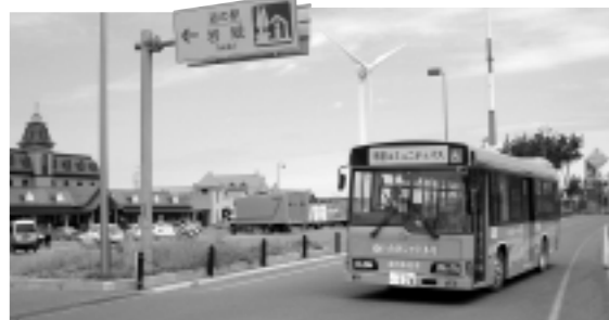
亀田道川線を走る「岩城シャトル号」