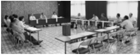
コミュニティバスの試験運行にかかる沿線地域の利用を話し合った「生活バス利用促進懇談会」