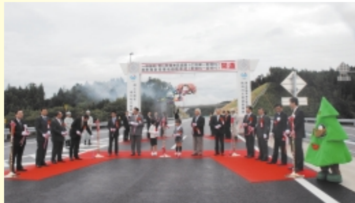
関係者による喜びのテープカット

ほ市間の四つのトンネルには五十メートルおきに消火器が設置されています。また、非常電話は五つのトンネルの二十二箇所に設置されています。