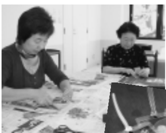
生涯学習奨励員の方たち 作製に当たる

これは同地域の生涯学習奨励員の会(会員九人の企画によるもので、特産を知ってもらうとリンゴの花を押し花に。また、由利本荘の方言を紹介した添え書きも付けられ、親しみにあふれています。