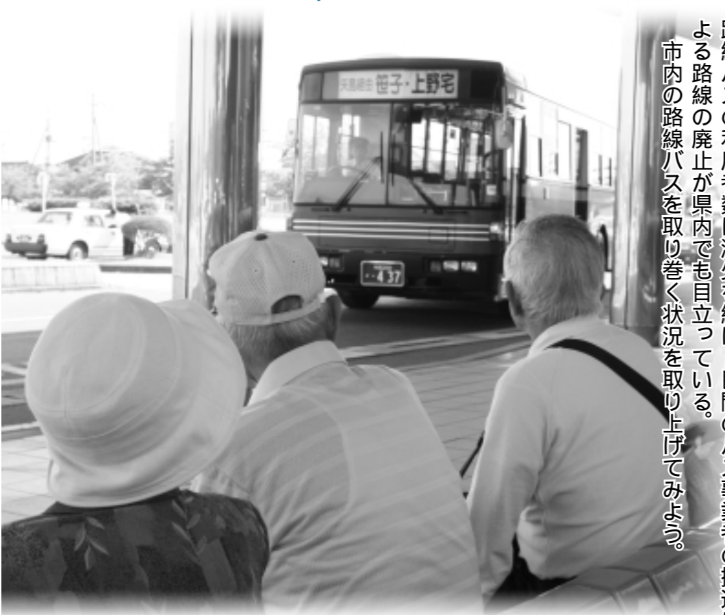
由利組合総合病院前でバスを待つ人。このバスに次々と乗車して家路へ（9月21日）