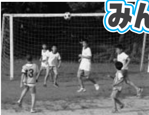
期間中はフリー参観です。詳細については各学校にお問い合わせください。