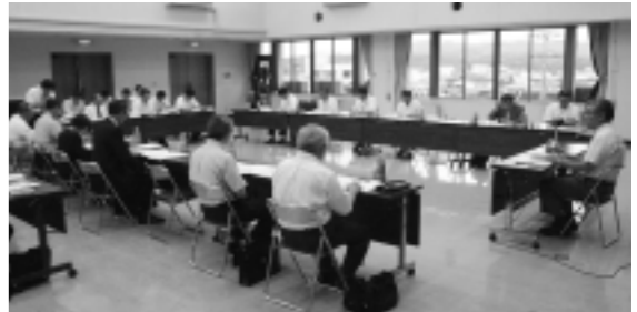
7月に開かれた「地域公共交通会議」

便数も期間も限られているが、運行の効果が認められるような結果が残せるよう、身近な生活の足として利用が図られなければならない。それを担っているのは、一にも二にも地域の皆さん自身だ。「必要だから残してほしい」という地域の切実な願いを共有するとともに、実際のコミュニティバスの利用に向けた一人一人の理解と協力、積極的な乗車につながる意識の高まりがあれば、順調な運行を続けることができるはずだ。