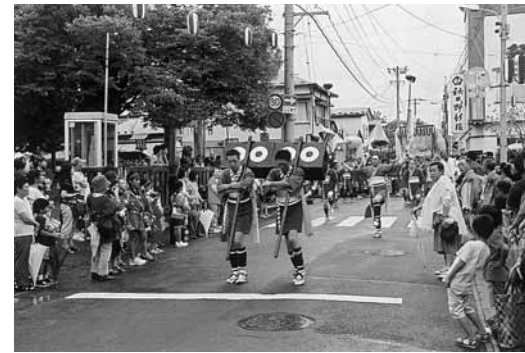
伝統の行列を見ようと、沿道にはたくさんの人