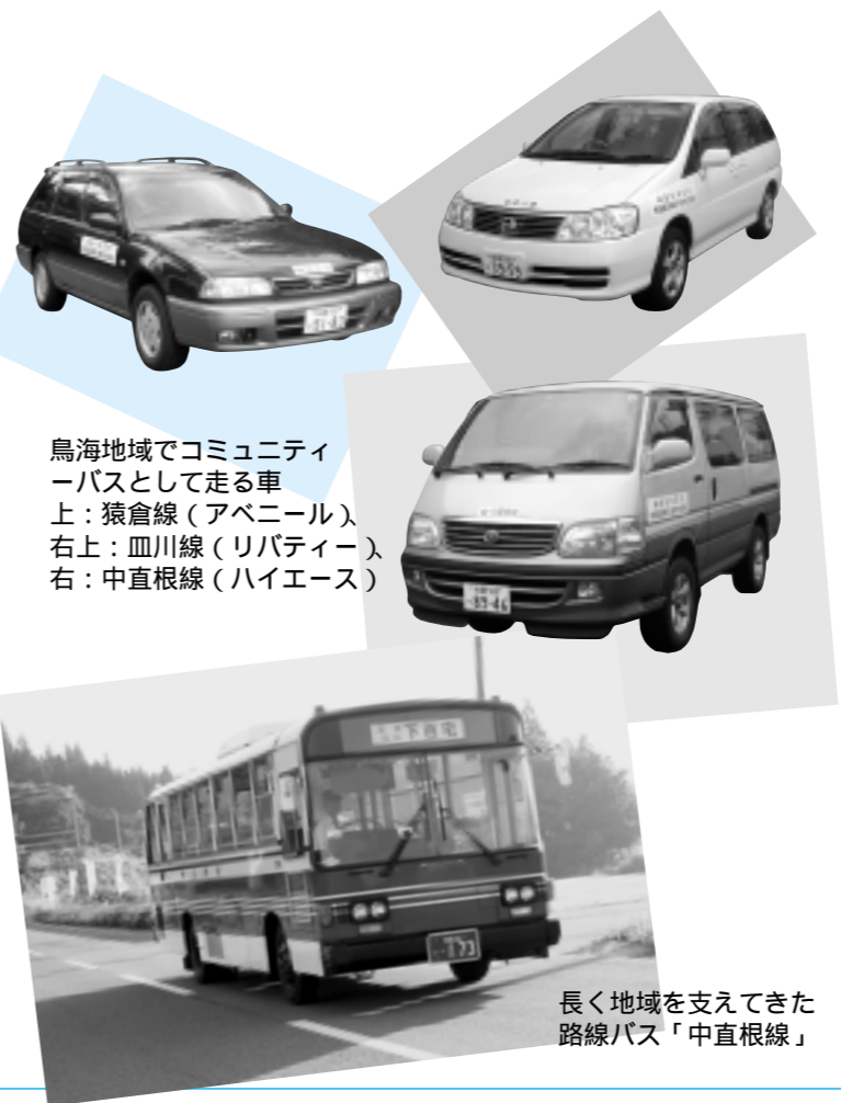
鳥海地域でコミュニティバスとして走る車 上：猿倉線（アベニール） 右上：皿川線（リパティール） 右：中直根線（ハイエース）

子どもたちやお年寄りなど、自家用車が運転できない人にとって、バスは便利な交通機関だが、その実情は厳しさを増している。市の取り組みを主体に、「バス」について考えてみたい。