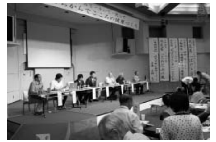
自殺予防の活動の大切さを確認したシンポジウム

地域で今年九月に発足した「オーブンハートオコジョ」などを例に挙げて、「自殺予防のポイントとなる気持ちを伝え合うことが家庭や職場で、また同僚とまでできない。そのためまず地域でできることを考え、できることからやってみよう」と呼びかけました。活動発表では、青森県の十和田市とつがる市、岩手県久慈市から参加した活動団体、それに本市の