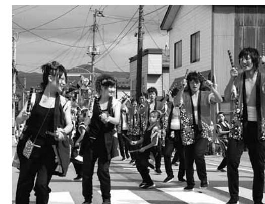
若い力が活気を生んで

神輿を送り終えた神楽太鼓は、駅前の大鼓競演会場へ移動。各丁内独特の節回しから繰り出される太鼓の音は、会場を熱気の渦に包み込み、大勢の観衆を魅了しました。翌日九日の祭典は、流行を取り入れたもの、伝統を重んじたものなど各丁内の若衆が趣向を凝らした山車と踊りで町を練り歩きました。笛や太鼓、山車や踊りの行列は、いたるところで観衆を喜ばせていました。午後には宇賀神社で一夜を過ごした神明様が、再び神輿で神明社を目指し、にぎやかに見送られていきました。