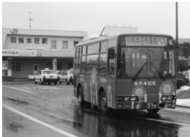
羽後本荘駅から市街を循環する「ごてんまり号」

岩城地域のコミュニティバスは、平成十三年度旧岩城町が新しい交通システムを目指し、試験運行をスタートさせ、平成十五年四月から「南沢線（上虹田、亀田出張所間、8・1分）」、平成十六年十月から「亀田道川線」（亀田出張所、