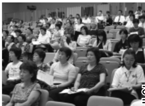
聴講する女性の皆さん

秋田わか杉国体の期間中、全国から本市を訪れる方々を歓迎し、心を込めたサービスを提供しようと「おもてなし講習会」が九月十九日、西目