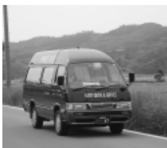
南沢線のジャンボタクシー

亀田道川線は、道川地区と亀田地区の交流促進、公共施設の利便性の向上などを図るために新設された路線。市の直営で一日十便（五往復）を運行中。こちらの車両は低床型のノンステップバス。年間の利用者数は約五千百人を数える。