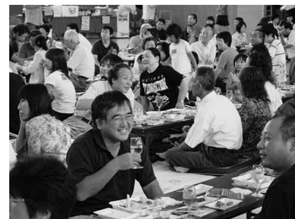
おいしいワインを手に、語らいのひととき

行列には笛や太鼓に合わせてたにぎやかな舞で無病息災を祈願する唄の無形民俗文化財・日役町獅子踊りや、各町内がこの日のために趣向を凝らした山車も連なつて悠々と行進。約一キロにもおよぶまつりの列は、通りを江戸情緒一色に包み込み、ひと目見ようと訪れたたくさんの人々を魅了していました。