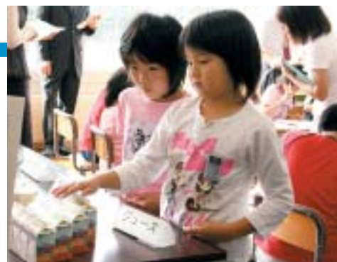
身近なものを題材に、かけ算の仕組みを考える子どもたち（八塩小二年）