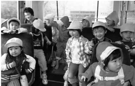
最後の路線バスに乗った園児たち

会員たちは、交通安全のメッセージを訴えるチラシや短冊のついた手作りのマスケット人形を運転手に手渡ししながら、待ち望んだ高速道路が開通しました。事故が起きないことを何より願っていますと話していました。