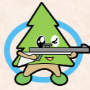
ライフル射撃競技・50m伏射60発のファイナルに出場した8人(県立総合射撃場で)