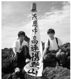
記念の垂れ幕を掲げる2人の生徒会長

九月十四日、中学校と高校の全校生徒が合同で鳥海登山を行いました。登山日和となった当日、両校の生徒と教職員など約五百人が矢島口から山頂を目指しました。山頂では二人の生徒会長が垂れ幕を掲げて生徒同士の交流と連帯に思いを馳せていました。