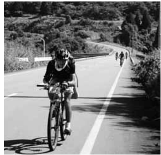
一周150キロの鳥海山を回る

また、天然記念物の「岩館のイチヨウ」や、法内の八本杉」では巨木を見上げながら、地元文化財保護協会の説明に聞き入っていました。