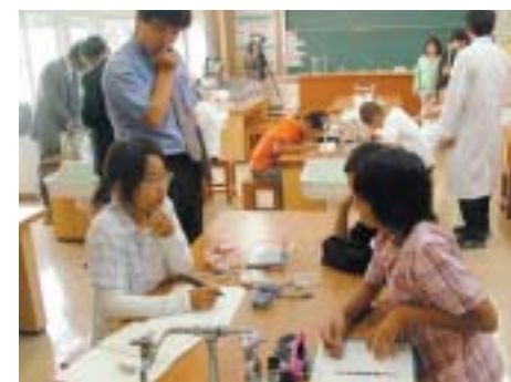
意見を出し合い、話し合いを深めていく子どもたち（高瀬小六年）