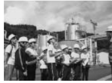
鉱場見学会をメモをとりながら説明を聞く児童たち