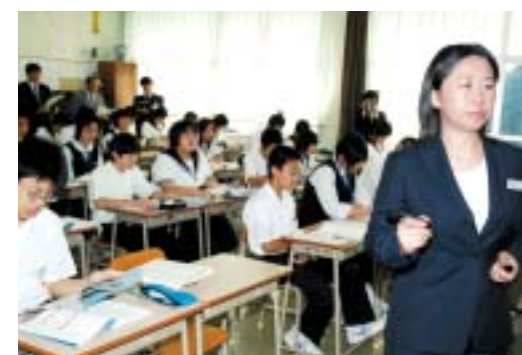
国語の授業に取り組む東由利中の3年A組