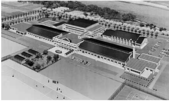
矢島中高連携校の完成予想図

新しい校舎は鉄筋コンクリート造りと木造造りを併用した二階建てで、中学校と高校が管理棟や屋外運動場などの施設を共有し学習活動や行事などで生徒間の交流が図られることが大きな特色で