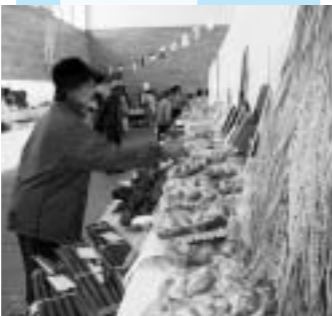
昨年の米まつりより