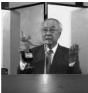
採鉱したサンプルを手に講演した棚橋社長

鮎川地内に由利原鉱場のある石油資源開発発株は十月四日、南由利原で植樹会を行い、そ