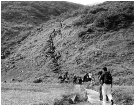
生徒など500人が山頂を目指す

て立派な人材に育つことを期待します」とあいさつしました。中高連携校の敷地面積は約六万二千平方メートルで、内中学校の建築面積は約四千五百平方メートル、延べ床面積が約五千九百平方メートル。また、高校の建築面積は約三千六百平方メートル、延べ床面積が約五千三百平方メートルの規模で、来年度中に完成し平成二十一年度から新校舎での学校生活が始まります。