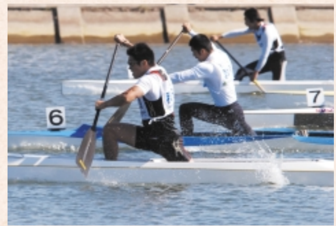
本市では、本荘地域のカヌー競技をはじめ、市内六地域七競技で熱戦を展開。今号では、本市で行われた各競技の模様をダイジェストでお伝えします。

昭和三十六年以来、四十六年ぶりに本県での開催となる、わが国最大のスポーツの祭典「秋田わか杉国体」が、九月二十九日の県立中央公園県営陸上競技場(秋田市雄和)での開会式を皮切りに開幕。十月九日までの十一日間、県内各地で全国から集結した精鋭たちによる熱い戦いが繰り広げられ、訪れた多くの観衆に感動と興奮を与えました。