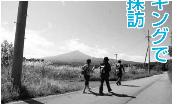
鳥海山を見ながら初秋の鳥海高原をハイキング

の金ヶ沢会館をスタートし、全長七・五キロのコース内に設置されたチェックポイントで地域にまつわる問題を解きながら、ゴールのフォレスト鳥海を目指して歩きました。天候に恵まれたこの日は、途中の問題に悪戦苦闘しながらも、思い思いに秋晴れの鳥海高原と鳥海山を満喫しながら約二時間かけてゴール。フォレスト鳥海の温泉で汗を流した後の閉会式で順位が発表され、地元の特産品などの賞品が手渡されると大きな歓声が沸き起こりました。