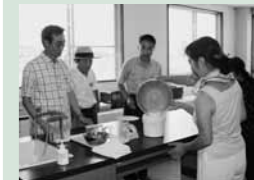
アイスクリーム手作り体験の様子(花立牧場公園「ジャージーハウス」にて)

「ふるさと鳥海の会」の会員とその家族を対象に行われた今年のツアーは、昨年に引き続き、新しいふるさと「由利本荘市」の各地域の自然や歴史を語り継ぐ数々の観光スポットを見学しました。参加した会員たちは手作り体験などを通してふるさとの魅力を再認識し、思い出深いひとときを過ごしました。