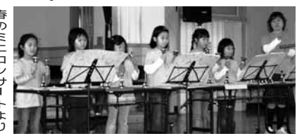
春のシンフォニー

旧鮎川小学校「秋の交流会」 お問い合わせのうえ、ぜひおいでください。参加者には地元産の新米おにぎりや漬物などの昼食を準備します。