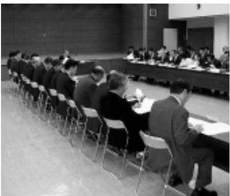
コメの生産配分数量などを協議

ことが期待されます。いつも申し上げていることですが、皆さんが健康で、今年一年全力を発揮できる職場づくりと、明るい家庭を育てていただきたいと思います。