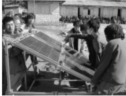
完成した太陽光発電システム

私は一年生のときから自主研究制度によってソーラー発電システムとLEDを用いた照明システムについて取り組んでいます。昨年は、ネパールの電気のない村の小学校に「消費電力が小さいLEDを用いて散光させ、広域を明るくする照明システム」をテーマに研究を重ね、完成したシステムを設置してきました。今年度は研究テーマを「ソーラー発電のもと、蛍光灯を用いたシステムを構築する」としています。ソーラー発電シ