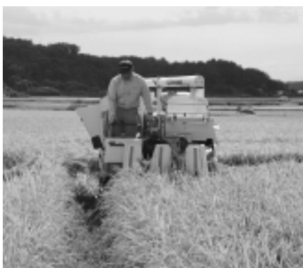
需要情報を元に計画的な米の生産

米の需要情報による本市の十九年産米の目標数量は、十八年産米生産目標数量に比べ、二百八十九ト多し四万四千四百五十六ト。協議会では合併前の旧市町に設置されている協議会支部ごとに枠を定め、コメの集荷業者の認定方針作成者に需要に関する情報として目標数量を示します。認定方針作成者は水田台帳面積を