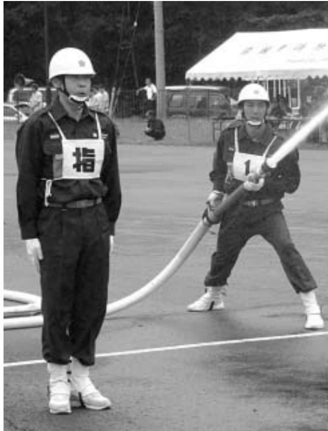
市消防団の技術は県内で高い評価を得ています

市では消防団OBの再入団や、地域によっては女性消防団員の入団を図るなどして、団員確保に当たっています。地域のために、あなたも消防団に参加しませんか？