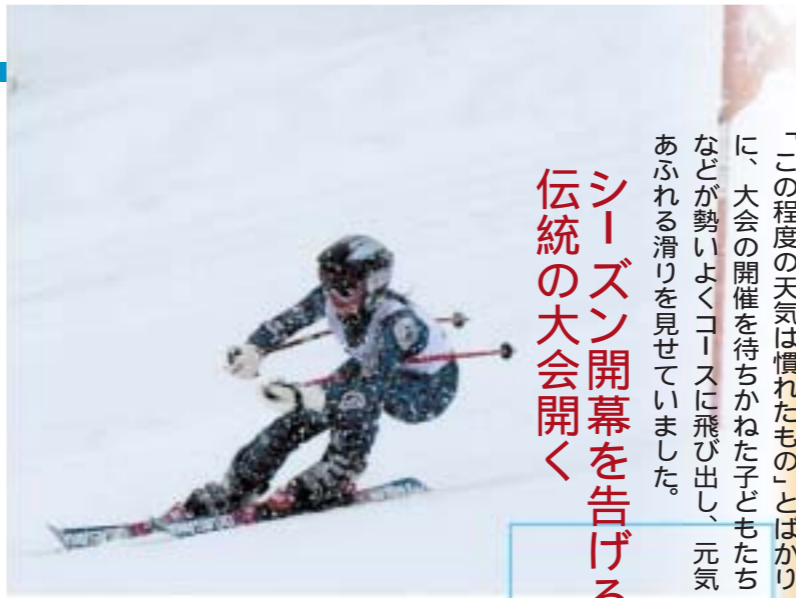
鳥海高原矢島スキー場で「エランカップGSLスキー大会」