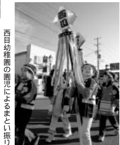
西目幼稚園の園児によるまとい振り