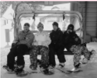
クワッドリフト一番乗り!

なお、消火器の普及とともに、点検や薬剤の詰め替えと偽り、高額な代金を請求される事例が各地で発生しています。その手口は突然電話をかけたり、直接住宅を訪問したりし、さも市消防関係団体のように振る舞ったり、または消防団員を装ったりし、時には町内会あての文書などを示して購入を迫る、というものです。もし、少しでも不審な点を感じたら、きっぱりと点検を拒否するとともに、お近くの消防署に通報してください。