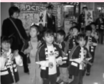
園児が「火の用心」呼びかけ

12月16日に岩谷保育園の園児が、23日には川内保育園の園児がそれぞれ幼年消防クラブとして、市内のスーパーで防火PRを行いました。「火の用心してください！」