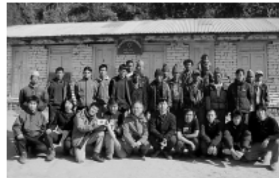
ネパール・ナチェ村小学校の前にて

私がこの自主研究で得たことは、「ものづくり」の楽しさと難しさでした。理論では大丈夫でも実際は理論とは異なる結果になることがあります。研究を進めていくうちに多くのことを知り、それに関する理解できて自主研究をやっているよかったです。