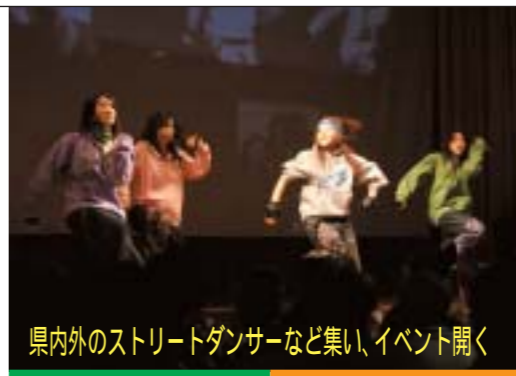
県内外のストリートダンサーなど集い、イベント開く

強いビート感特徴とする、黒人 発祥の音楽・ブラックミュージック をテーマとしたイベントが一月六日 アクアパルで開催され、若者たちが ストリートダンスやライブを楽しみ ました。「ブラックミュージック・ コミュニケーション」と題されたこ の催しは、十代の若者たちを主な対 象に、県内外で活躍するダンサーや ミュージシャンが集い、クラブスタ イルのイベントとして行われたもの です。