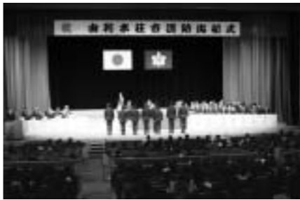
文化会館で行われた式典

市消防出初め式が一月五日に行われ、消防団員たちが市民の生命と財産を守る心意気をあらたにしました。