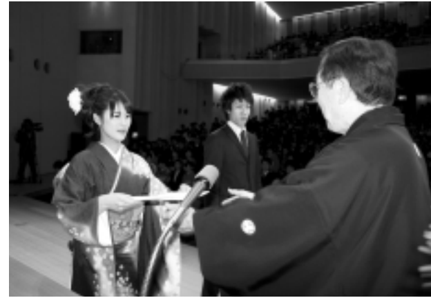
成人証書と記念品を受け取る新成人代表