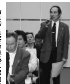
昨年12月25日には大内地域で開催

市長が直接各地域に出向いて市政を語り、また地域の声を聞く「市長とまちづくりを語る会」が各地域で順次開催されています。 この会は、広聴活動事業の一環として実施しているもので、現在、矢島地域と大内地域が終了しています。他地域での開催については広報紙でお知らせいたします。