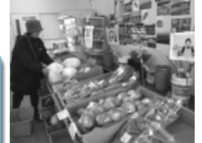
生産者の顔が見える直販所(ゆりちゃん市場)

できるとあって消費者の人気を呼び、開店と同時に品切れとなる作物も少なくありません。営業日や開店時間が直販所によってまちまちですが、季節の物が並び、また農家の手作りの加工食品など品揃えも豊富になって、売上高も六億円弱と推計されています。農家の主婦が組合員となって運営に携わる直販所が大半。