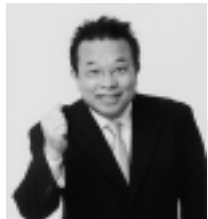
島田洋七プロフィール

http://www2.chokai.ne.jp/k-hiro/genki.htm