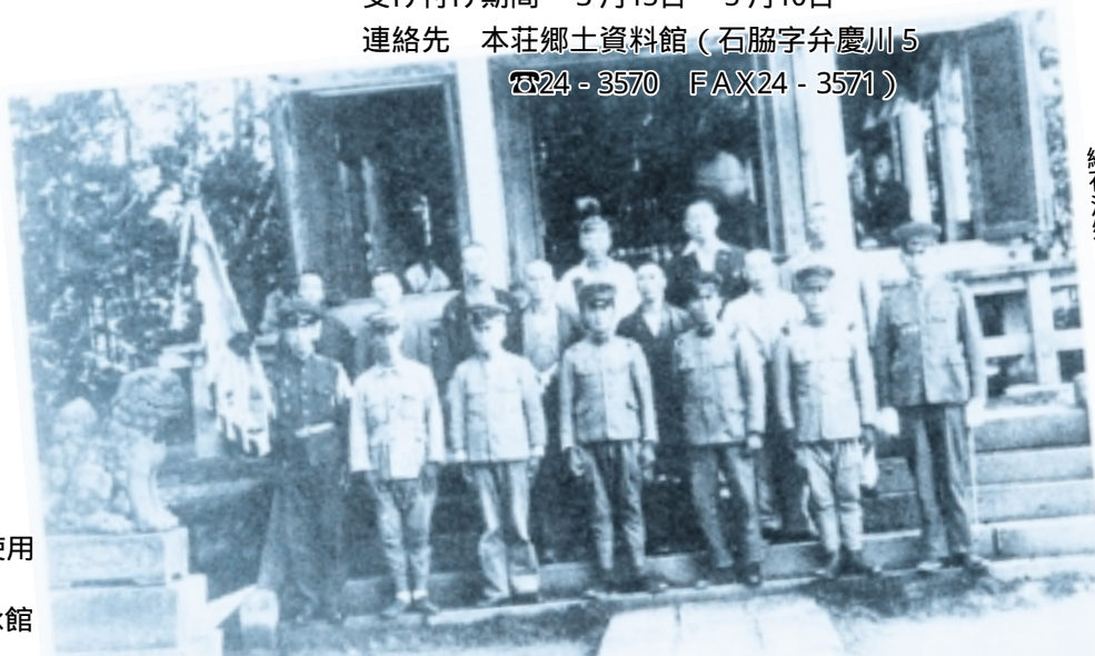
『続石沢郷土誌』から