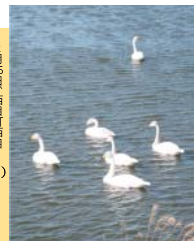
2月25日 西目町西目 釜ヶ沢ため池で

時に添い歴史つらぬき 里をうつるおし人をむすんで 子吉川 海へと向かう水の道 その海はせめぎあう世界へひらく 先人の知恵に学んで今日を生きる ふるさとの四季おりおりに 花はほほえみ風は薫 かお って 鳥海 とりのうみ の 山きよらかに裾をひき 頂はめくるめく宇宙につづく 子どもらとともに夢見て明日を創 つく る