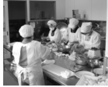
加工所で試作を繰り返す組合員