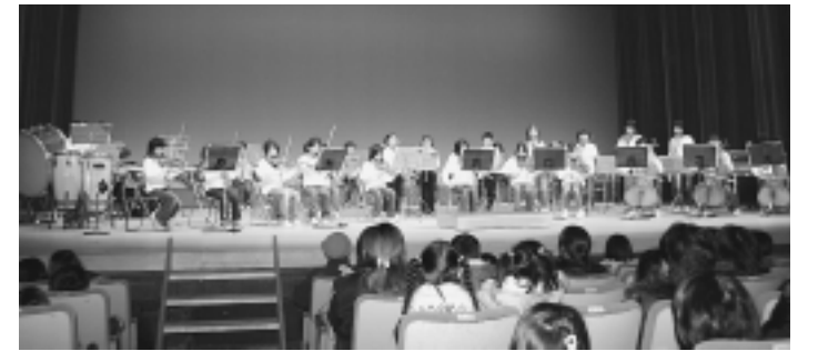
目を輝かせて演奏などを楽しんだ入学おめでとう大会

4月から新1年生になる子どもたちを対象とした「本荘地域入学おめでとう大会」が2月24日に行われ、この日を楽しみにしていた親子連れなど約550人が本荘文化会館で楽しいひとときを過ごしました。