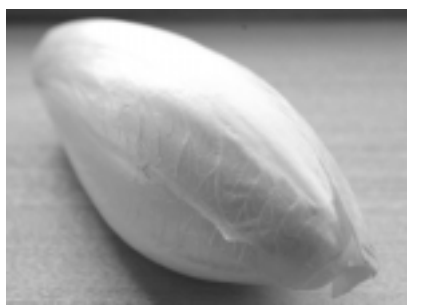
新規導入作物の一つとして検討されているチコリ

直販所には消費者が農家(地域)との交流と地元の一級品を求めて来ると思ってもいい。農産物ボジティブリスト表示など安全、安心の求めへの対応を怠ると消費者はすぐ逃げていく。豊富な品揃えに加え、良いものは高くても多いものは安いなど妥当な値頃感と季節感を出すことが大切だ。由利本荘市内の直販所にはスイカ、メロン類の果実野菜が少なく、いちじくも出ていないがこれらはすぐ売れると思う。また冬のネギが不足している。