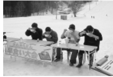
声援が飛んだ「さぬきうどん早食い大会」