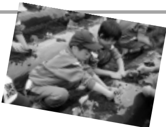
豊かな大地を舞台に、農作物栽培の体験学習に取り組む子どもたち