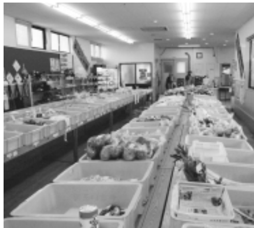
冬場の野菜の品揃えも課題の一つ

平成十一年に組合員三十七人からスタートした直売所の「やさしい王国」は八年目を迎えました。現在組合員が四十六人になり、一日二人の組合員が輪番制で「笑顔、安全、安心」をモットーに運営しています。百品目ほど販売していますが同じ時期に作目が重なるので、作期の調整や出荷の調整、根菜類の保管を工夫、冬場の野菜出荷も必要です。マンネリ化防止の意識改革にも努めています。