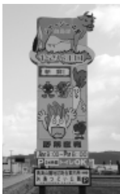
国道沿いの大きな誘客看板

自分たちが生産し、作った物を直接消費者に売る直売所が増え続けています。現在、由利地区直販連絡会に加入している由利本荘市とにかほ市にある直売所は二十七カ所。 直売所は生産者の顔が見え、地場産の安全で安心な農作物が購入