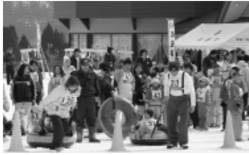
さまざまな雪上ゲームを楽しむ親子