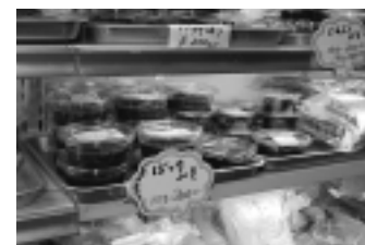
手作り加工品が並ぶ(やさい王国)

農産品に付加価値をつけて販売する加工品の開発は、新しい農業ビジネスの最重要事項。直販所自慢の主な加工品を拾ってみました。季節によって販売されていない物もあります。漬け物・かき餅・なんばこ・ぼた餅・松皮餅・笹巻き・手作りきりたんぼ・アンパン・カナカブ漬け・米菓子・ゆべし・ヨーグルト・手工芸品・エゴマ・りんごジュース・山菜類缶詰。