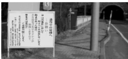
注意看板(上)と警戒の続く災害現場

本年二月二十二日早朝、市道山内畑村線(本荘地域と東由利地域の境)で二度目の地すべりが発生し、同路線は現在通行止めになっています。崩落の高さは約百メートル、道路も約百五十メートルにわたり土砂で埋まっています。市では緊急対策として、崩落土砂の移動などを感知した場合、直ちに危険を知らせる「センサー」