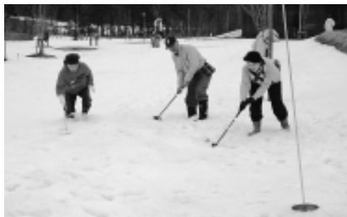
ボールのコントロールに苦労した雪上パークゴルフ

「ひがしゆり雪まつりツア二〇〇七」の一つ、「早春やしお元気まつり」が三月四日、八塩いこいの森で行われました。「積雪の少なさは、これまで経験のないほど」と話す関係者が見守る中、スノーモービルが牽引するゴムボートに乗ってスリルを味わったり、雪上パークゴルフに興じたりして、八塩山のふもとの一日を楽しくしました。