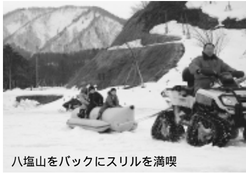
八塩山をバックにスリルを満喫