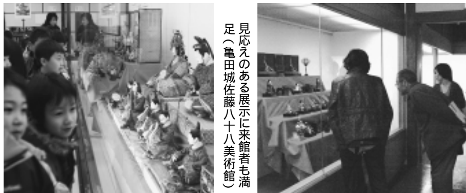
生駒氏ゆかりの人形を見て回る子どもたち(矢島郷土文化保存伝習施設)

また、「古典芸能を楽しもう」と題した落語家による落語と口上芸も観客を魅了。八つぁん、熊さん、ご隠居の問答でなじみの落語ではトンチのおかしさが笑いを誘い、江戸口上芸の「がまの油売り」と「居合ひ抜き」では、巧みな口上と迫真の技に引き込まれ、感嘆の声が漏れていました。