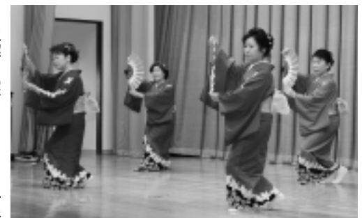
あでやかな踊りは学習の成果

市では自由に学習機会を選ばず、折し「だれでも、いつでも、どこでも」学べる生涯学習活動を推進しています。鳥海地域で二月二十五日、日ごろの学習成果を披露する生涯学習発表会が開催されました。発表会は地域の学習活動の拠点施設紫水館で行われ、コーラスや踊りなど十のグループによるステージいっぱいになっての発表に詰めかけた約三百人の観客から盛んな拍手。幕間には小学生や生涯学習受講生の体験や実践発表があったほか、男女共同参画