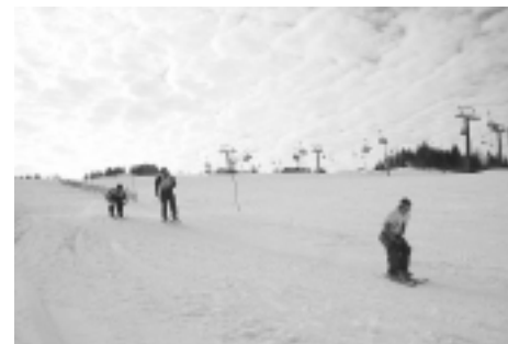
白銀の中で自慢の腕前を競って

白銀のスキー場を会場に、さまざまなイベントを楽しむ「2007鳥海高原矢島スキー場スノーフェスティバル」が三月四日、高速クワツドリフトを新設してにぎわう矢島スキー場で行われました。呼び物のさぬきうどん早食い大会には、子どもから大人まで三十人が参加。家族や友達との挑戦する姿に、盛んな声援が送られていました。