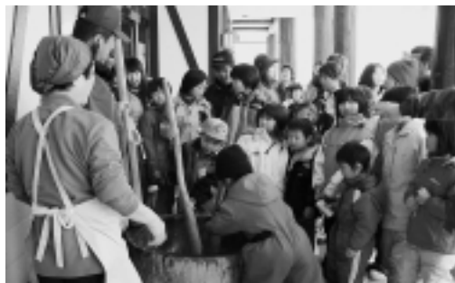
もちつきは子どもたちの人気イベント

春の訪れを感じさせる暖かな天候となった三月四日、「オコジョランドまつり」が行われました。人気を集めたのはスノーモービルや雪上車の体験試乗会。雪上を疾走するたびに、会場には大きな歓声が響きました。