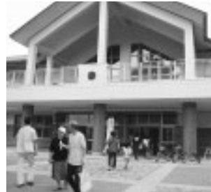
上校舎玄関 左天窓からの光あふれる2階廊下 下ガラス戸が開放感を演出