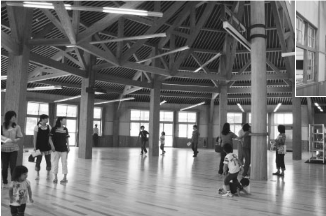
太い柱と梁で造られた明るい食堂

昨年からの改築を進めている西目小学校新校舎の見学会が八月十七日に行われ、およそ七百三十人が木の質感を生かした真新しい校舎の雰囲気を楽しみました。この一般公開は、「完成した校舎を見てもらおう」と市教育委員会が計画したものです。